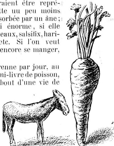
Carotte mangée par un homme ou par un âne.

Si vous préférez les œufs, un homme ne commence à en manger qu'à dix ans — simple supposition — et n'en mangeant que deux par jour — autre hypothèse — en aura mangé 43.800 en soixante ans, à raison de 730 par an. S'il n'en prend que quatre par semaine, cela lui fera néanmoins 12.485.