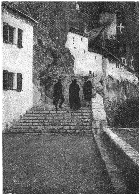
Le Monastère d'Astorg.

« S'il se trouve un lâche, on lui enlèvera ses armes et il ne pourra plus les porter de sa vie, et ne jouira plus d'aucune considération; on lui attachera un tablier de femme autour du corps pour bien indiquer qu'un cœur d'homme ne bat pas dans sa poitrine. »