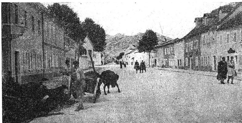
La rue principale de Cetinje.

compétitions s'élèvent pour menacer l'indépendance du Monténégro, il est intéressant de jeter un coup d'œil rapide sur cet Etat, le plus petit d'Europe. Le Monténégro, en effet, ne mesure dans sa plus grande longueur que 106 kilomètres et 62 km. dans sa plus grande largeur. Son sol est généralement montagneux, mais il existe quelques vallées, en-