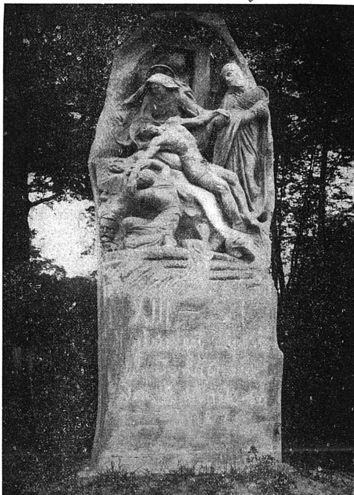
La Station du Chemin de Croix