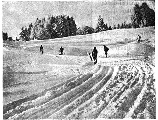
Chemin parcouru par les skieurs près de St-Cergues

Il y a quelques années, l'Alpe n'était guère visitée en cette saison avec l'entrain qu'on y met aujourd'hui. Le ski, jadis inconnu chez nous, est devenu d'un usage constant parmi les sports d'hiver. Les concours de skis ont fatalement obtenu droit de cité, et parmi les différents exercices inscrits aux programmes, les organisateurs des courses ont ménagé, dès le début, une place en vue au saut en longueur, ou mieux en profondeur.