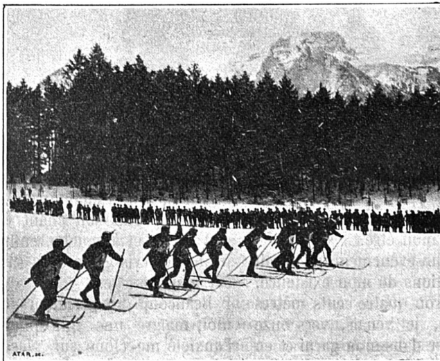
A Glaris (22 janvier 1905) Le départ de la course des sous-officiers et soldats

actuellement les 25 mètres, et le record norvégien est de 35 mètres environ. Que ferons-nous après avoir décrit cette fabuleuse trajectoire ?