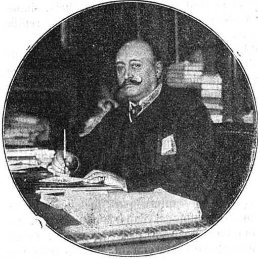
M. François Kossuth dans son cabinet de travail.

Les élections législatives en Autriche-Hongrie, amenant la chute du ministère Tisza et portant un coup terrible au parti libéral, ont mis en relief la personnalité du chef du parti de l'indépendance hongroise François Kossuth.