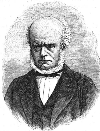
Le peintre Menzel.

Né à Breslau en 1815, il fut à vrai dire son propre maître.