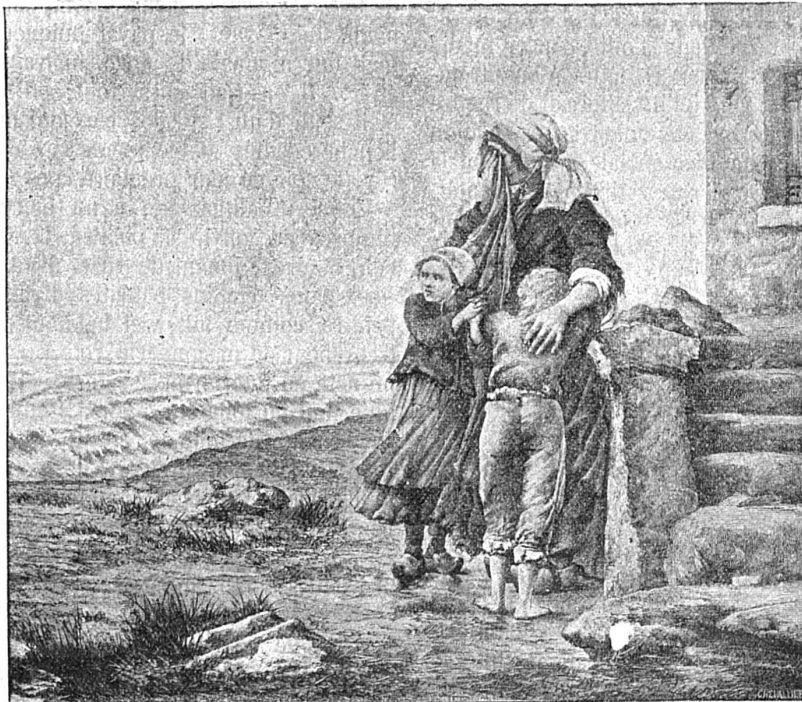
Eplorés... le pilote est en mer... d'après le tableau de BATON

pièces de cinq francs... c'est une somme, ça !