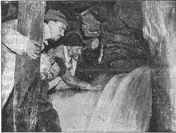
Irruption d'une source.

Il y a eu ensuite des mécomptes géologiques, et, enfin, de grosses venues d'eau froide et d'eau chaude. Des sources, débitant des milliers de litres à la minute apparurent successivement sur les deux fronts d'attaque. On se trouva devant des nappes souterraines provenant de laës ou d'infiltrations. On réussit à les capter presque toutes et à les évacuer. Il a fallu modifier les bases mêmes de l'entreprise. Le forfait primitif de l'entreprise arrivait à un total de 69 1/2 millions. Un nouvel arrangement conclu en raison des difficultés non prévues, augmenta ces chiffres d'environ 8 millions. Sur le côté suisse, comme on travaillait à contre-pente, on dut arrêter la perforation mécanique le 22 novembre 1903 et barrer la poche qui