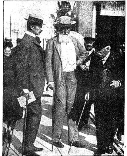
Le roi des Belges à Monaco