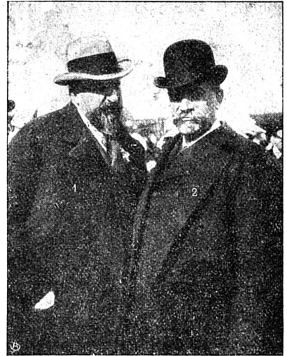
Les princes Ferdinand de Bulgarie et Albert de Monaco assistant à l'ouverture de l'Exposition à Monaco

Maréchal Oyama, le victorieux, est né en 1843. C'est lui qui prit une part active à la restauration du Mikado, en 1868, et réprima l'insurrection de Satsouma (1877). En 1880, il devint ministre de la guerre. Il était en France chargé d'une mission d'études militaires, au moment où éclata la guerre franco-allemande de 1870-1871, à laquelle il prit part en se mettant du côté des Français. En 1884 il retourna en Europe pour y étudier l'organisation militaire des différents Etats. Pendant la guerre sino-japonaise, il était commandant du second corps d'armée, et s'empara de Port-Arthur et de Weihaiwei. C'est à lui que revient l'honneur d'avoir su faire