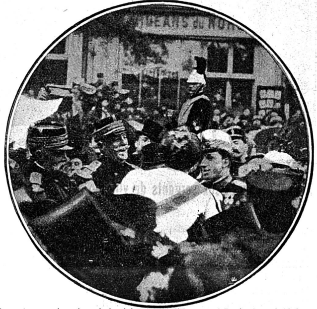
Une scène comique lors de la visite du roi d'Espagne à Paris. Le roi Alphonse doit embrasser la reine des Halles qui prononce quelques paroles souhaitant la bienvenue à Sa Majesté.

la République, un homme, armé d'un poignard, voulut s'élaner sur le jeune monarque, mais le malfaiteur fut de suite maîtrisé et ligotté. Le jour suivant, le 31 mai, au moment où le roi et M. Loubet revenaient de l'Opéra à minuit un quart et que le cortège tournait l'angle des rues Rohan et de Rivoli, une forte explosion se produisit, causée par une bombe jetée dans la direction de la voiture royale. Un cheval s'abattit, tué sur le coup. Une quinzaine de personnes furent relevées avec des contusions plus ou moins graves, heureusement aucune d'elles n'étant dangereuses. Le roi avait conservé tout son sang-froid; de suite après l'explosion, il s'était levé dans la voiture, saluant la foule qui lui fit une ovation enthousiaste. Le roi feignit de ne voir dans l'attentat que l'explosion d'un pétard comme on en jette en Espagne dans les fêtes populaires. Mais cependant les éclats de métal, criblant la capote et l'arrière de la voiture et blessant un grand nombre de personnes et plus de dix chevaux, prouvent bien qu'il ne s'agissait pas d'un inoffensif pétard. L'auteur de l'attentat est, croit-on, un sujet espagnol venu de Barcelone et arrivé depuis très peu de temps à Paris.