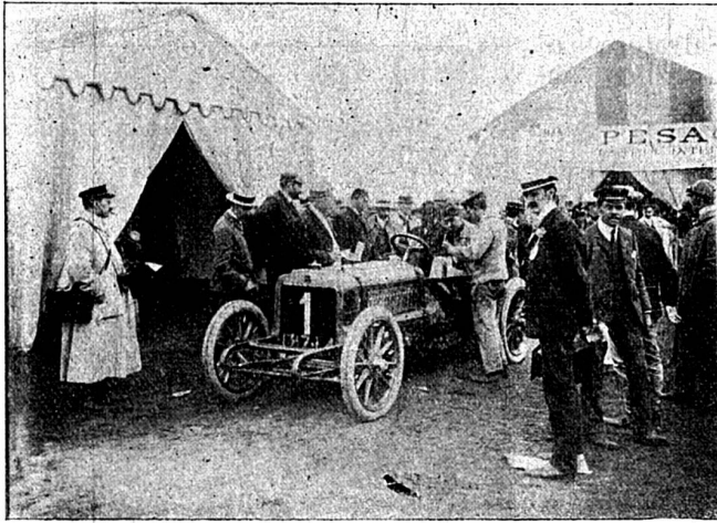
Théry, le gagnant de la coupe Gordon-Bennet, au pesage.