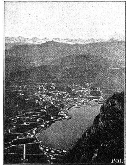
Lugano vu depuis le Monte-San-Salvatore.

Le touriste qui visite les trois lacs inscrit le Salvatore dans son programme de voyage. Cela tient au charmant panorama qui se déploie aux quatre vents du sommet enchanteur. Ce panorama que Boscoli, Bernardazzi, Imfeld surtout avec une précision étonnante ont dessiné de main sûre et habile, est vraiment beau, sans égal, par les gracieux détails d'avant-garde aimés par Whimper, les surfaces unies chères à Pœil, les teintes éclatantes, les contrastes, les lignes