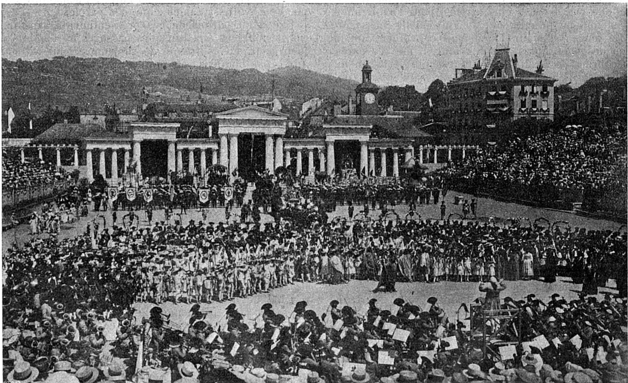
A VEVEY. — Fête des Vignerons de 1905. — Le chœur final; hymne au travail.

Seulement, quelle raison allait-il lui donner d'un refus de revoir immédiat? Il allait paraître inhumain