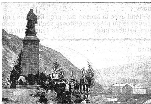
La statue de Saint Bernard au passage du Grand St-Bernard.

muletier. Ce sentier, élargi, a été transformé en route carrossable et les touristes pourront désormais aller en voiture de St-Maurice du Valais (Suisse), à Aoste (Italie), par le col du Grand-St-Bernard, illustré par le passage de Bonaparte et de son armée. En même temps, on a inauguré la statue de saint Bernard qui fonda l'Hospice qui porte son nom, et dont les moines, aidés de leurs chiens, d'une réputation universelle, ont arraché à la mort quantités de malheureux.