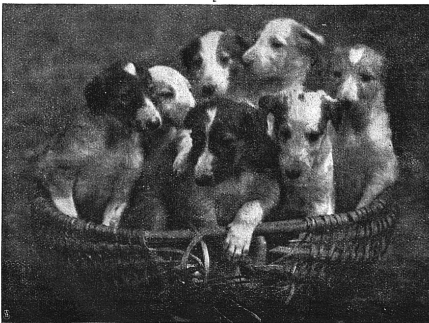
A L'ÉTROIT !

Il est destiné à recevoir, pour le vin, le pressoir, les pompes et les