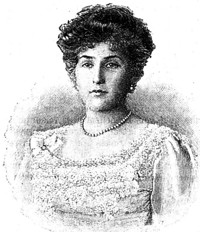
La princesse Ena (Victoria-Engénie-Christina) de Battenberg, la nouvelle reine d'Espagne.

sigues, ou s'escriant à l'entour des billards alignés au fond de la salle.