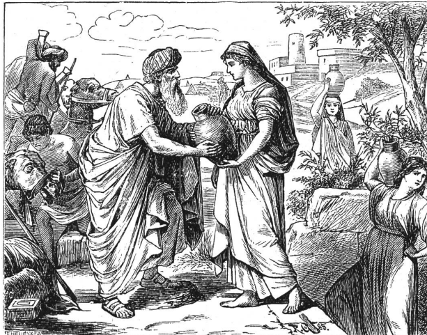
Wangemann: Rebekka am Brunnen.