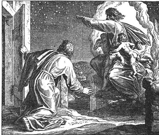
Schnorr von Carolsfeld: Abraham empfängt die Verheissung.

die Weckung des religiösen Sinnes, ja sogar die Ergötzung der Schüler in den Vordergrund gestellt wurden, konnte die Methode in diesem Fache ungeachtet der grossen Fortschritte in der Wissenschaft selber, keine wesentliche Verbesserung erfahren. Der Unterricht artete schliesslich in ein Geplauder aus, in dessen Kreis gar oft die unsinnigsten Erzeugnisse des krasssten Aberglaubens gezogen wurden, natürlich um diesen letztern zu vernichten, ähnlich wie man heute im Moralunterrichte das Gute etwa dadurch zu befestigen sucht, dass man den Kindern möglichst viel vom Bösen erzählt. Erst nach und nach brach sich die Überzeugung Bahn, dass eine richtige Betrachtung der Naturobjekte schon an und für sich eine den Aberglauben zerstörende Kraft in sich trage, dass sie die Freude an der Natur und die Ahnung einer göttlichen Weltordnung in der Jugend erwecke, dass also der Zweck des naturgeschichtlichen Unterrichtes mehr, als es bisher geschehen, in möglichst allseitiger Betätigung der Sinne und planmässiger Entwicklung und Übung der Verstandeskkräfte zu suchen sei. Diese Erkenntnis führte