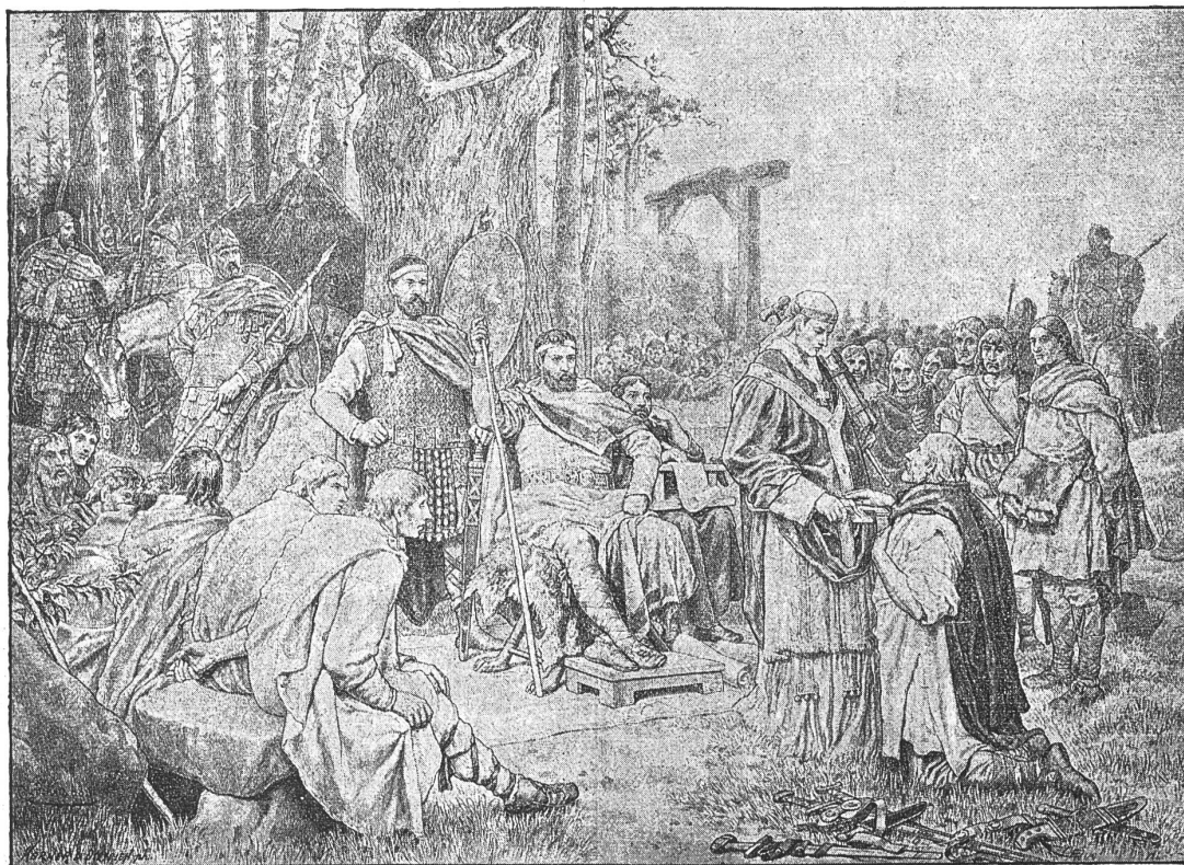
Lehmann, A.: Sendgrafengericht.

Hemmler, H. Wandbilder zur Anschauung für die alte und neue Geschichte. 25 Tafeln in Farbendruck. 60/49 cm. Preis mit Text 28 Fr. Inhalt: Blatt 1 und 2: Ägypter, 3—6: Hebräer, 7 und 8: Babylonier, Assyrer, Perser, 9 und 10: Römer, Makedonier, Griechen, 11: Germanen, 12: Gallier, Skythen, 13: Hunnen, 14: Goten, Longobarden, 15: Franken, 16: Ritter, 17: Landsknecht und Bauer, 18: Dreissigjähriger Krieg (Schweden), 19 und 20: Dreissigjähriger Krieg (Kaiserliche), 21: Friedrich Wilhelm, 22 und 23: Siebenjähriger Krieg, 24: Befreiungskriege, 25: Mönch und Nonne.