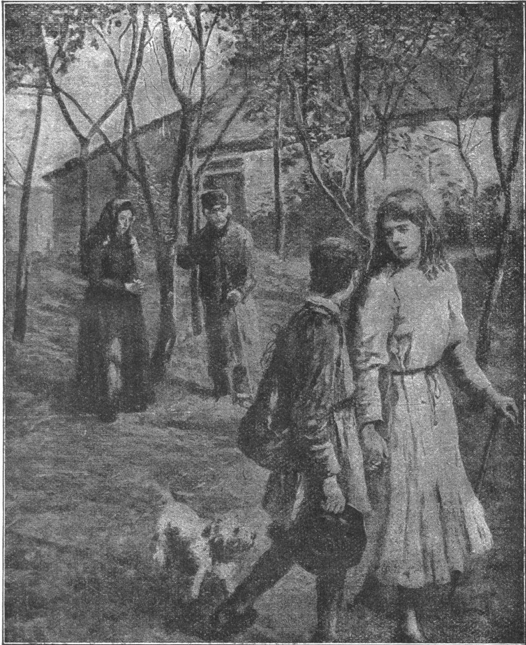
Der Abschied des jungen Tobias.

Aus „Fritz von Uhde, Eine Kunstgabe für das deutsche Volk.“ Mainz, Jos. Scholz. Fr. 1. 35.