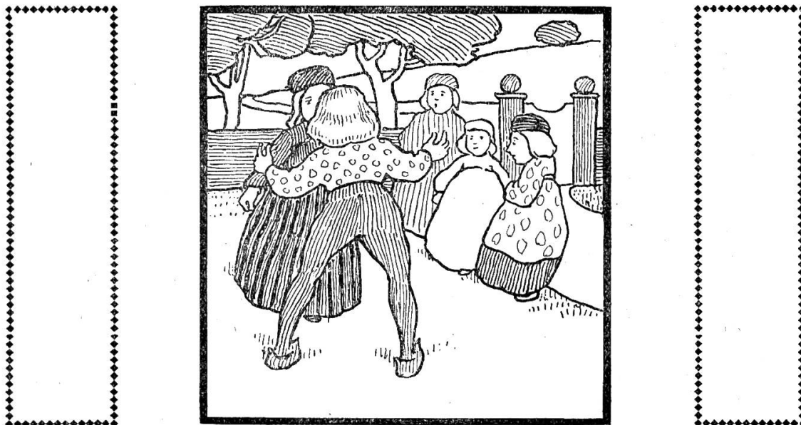
Illustration aus W. Kidd: Bäh, Schäfchen, Bäh.

In kräftigem Kontur mit guter flächenhafter Behandlung in Farben sind die kindertümlichen Bilder von Will Kidd in Bäh, Schäfchen, Bäh , mit Versen von Fritz Fink (Basel, Ernst Fink, Fr. 2. 50). Eine gute künstlerische Empfindung spricht aus diesen farbenfrohen Bildern, die dem Kinde viel Vergnügen machen.