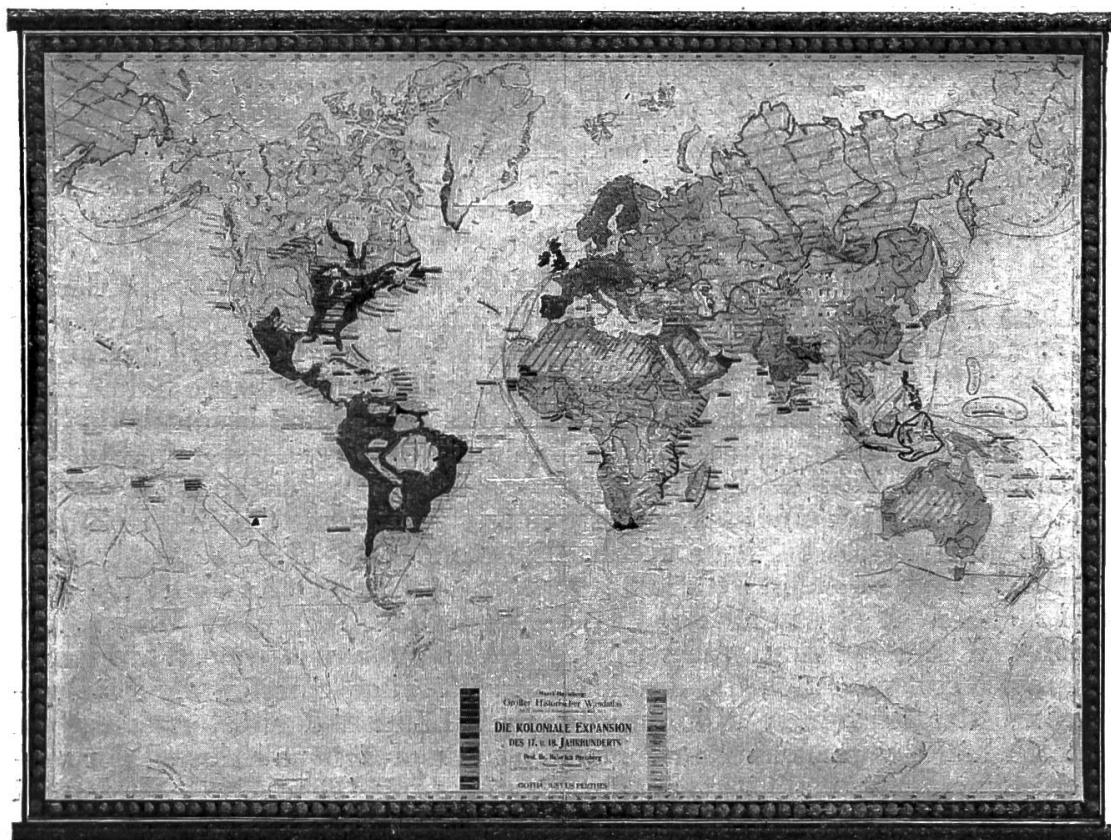
Die koloniale Expansion des XVII. und XVIII. Jahrhunderts.