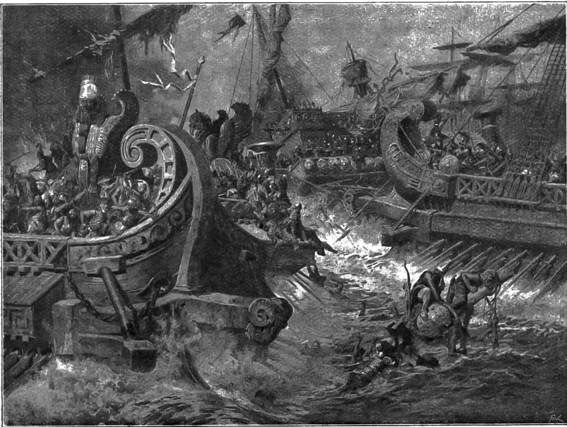
Nr. 1. Seeschlacht bei Salamis.

I. Wandbilder zur griechischen und römischen Geschichte und Sage. Unter diesem Titel eröffnet der Verlag A. Pichlers Witwe und Sohn, Wien, eine neue Sammlung farbiger historischer Wandbilder: Nr. 1: Seeschlacht bei Salamis von Prof. A. Hoffmann; Nr. 2: Ciceros Rede im Senat gegen Catilina von Prof. H. Schmidt; Nr. 3: Wagenrennen im Circus maximus von Prof. H. Schmidt; Nr. 4: Mucius Scaevola von Prof. A. Hoffmann. In Vorbereitung befinden sich: Hannibals Übergang über die Alpen; Untergang