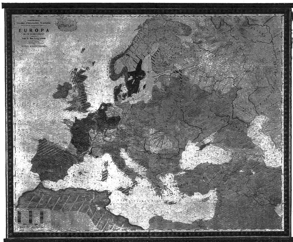
Europa im VIII. Jahrhundert.

Osten, den vorübergehenden Aufschwung des byzantinischen Reiches unter Justinian und zahlreiche andere historische Einzelvorgänge, Erzbistümer, Bistümer, Klöster, Schlachtorte usw. dargestellt.