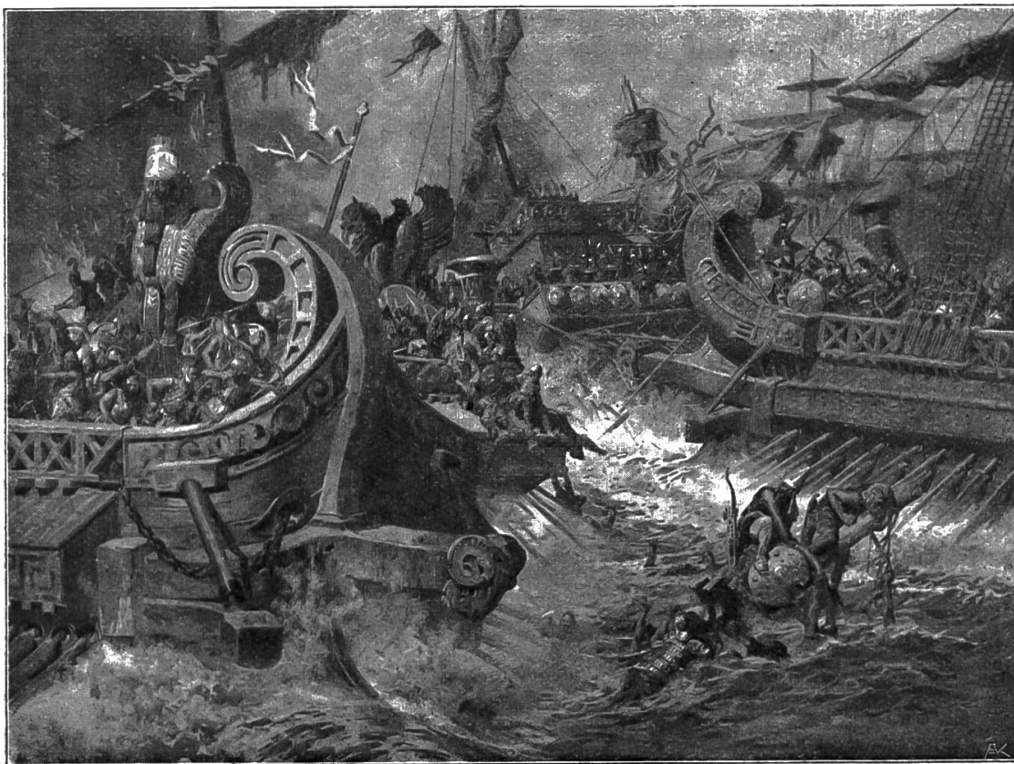
Nr. 1. Seeschlacht bei Salamis.

I. Wandbilder zur griechischen und römischen Geschichte und Sage. Unter diesem Titel eröffnet der Verlag A. Pichlers Witwe und Sohn, Wien, eine neue Sammlung farbiger historischer Wandbilder: Nr. 1: Seeschlacht bei Salamis von Prof. A. Hoffmann; Nr. 2: Ciceros Rede im Senat gegen Catilina von Prof. H. Schmidt; Nr. 3: Wagenrennen im Circus maximus von Prof. H. Schmidt; Nr. 4: Mucius Scaevola von Prof. A. Hoffmann. In Vorbereitung befinden sich: Hannibals Übergang über die Alpen; Untergang