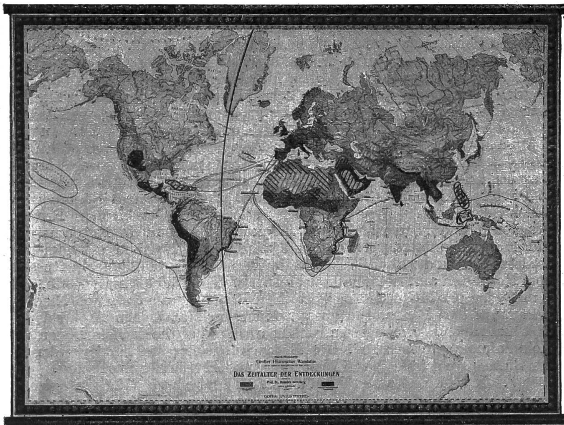
Das Zeitalter der Entdeckungen.