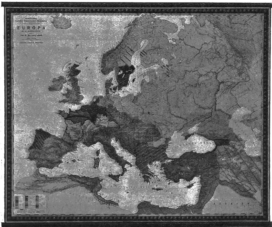
Europa im VI. Jahrhundert.

Europa im VI. Jahrhundert. Die Karte veranschaulicht die germanische Staatenbildung auf dem Boden des untergegangenen Römerreichs und zugleich die weiteste Ausdehnung germanischer Herrschaft in Europa und Nordafrika. Als Orientierungsbasis für die Darstellung ist das Jahr 511 (Tod Chlodwigs) angenommen. In äusserst klarer Weise gelangt die Entwicklung des Merowingerreiches zur Anschauung. Wir sehen ferner das Umsichgreifen der von nachrückenden türkisch-tatarischen Stämmen gedrängten Slawen im