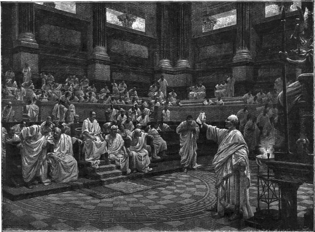
Nr. 2. Ciceros Rede im Senat gegen Catilina.

Pompejis; Das Orakel zu Delphi; Sokrates im Kerker; Die Gallier in Rom (Brennus); Cincinnatus am Pfluge; Ermordung Cäsars.