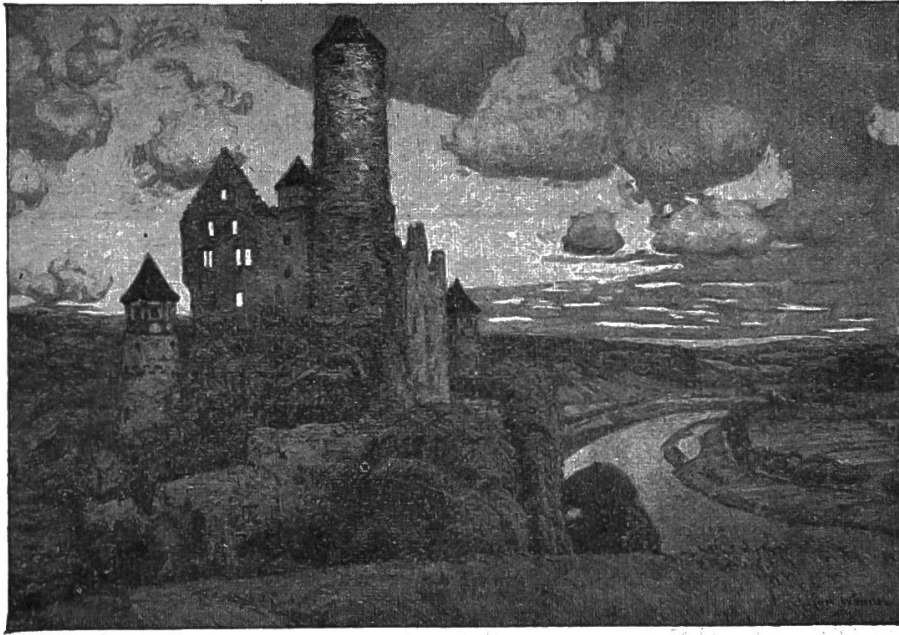
Nr. 8. Götz von Berlichingens Burg Hornberg am Neckar.