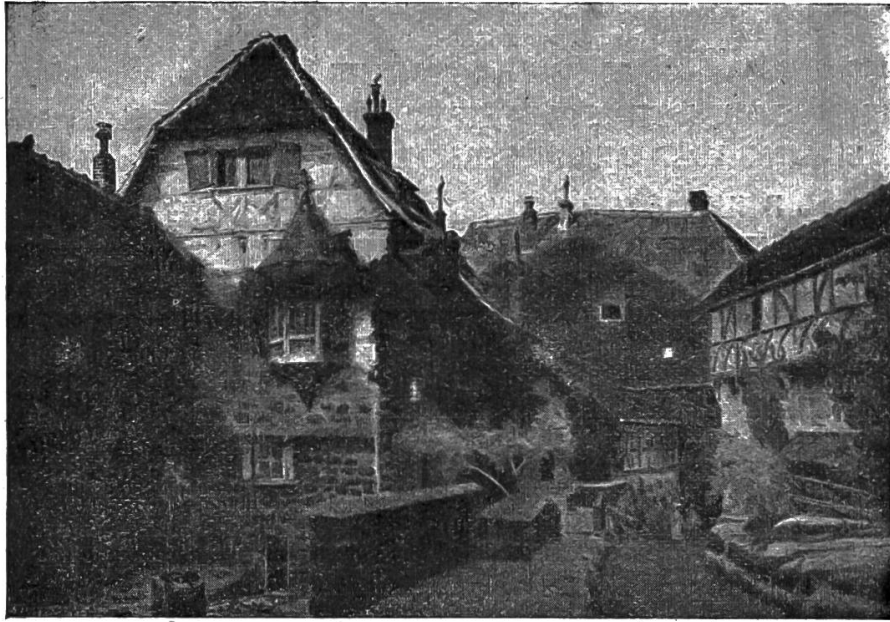
Nr. 5. Im Wartburghof.

stehen die Farben und die Linien gegen den hohen blauen Herbsthimmel. Malerisch spielen die Schatten an den winkeligen Gebäuden, unter den Dächern in Fenstern, Türen und Gängen. Das Bild raunt uns der Vergangenheit Erinnerungen ins Ohr. Farben- und Lichtfülle sind Symbol des bunten Gewebs von Sagen und Geschichten, die diese Stätte umspinnen. — Nr. 6. Am Ulmener Eifel-Maar (v. K. Messerschmidt). Aus dem alten Kratersee und der Ruine auf der Höhe redet die Vergangenheit zu uns. Wo der See wie ein leuchtendes Auge aus der Vertiefung blickt,