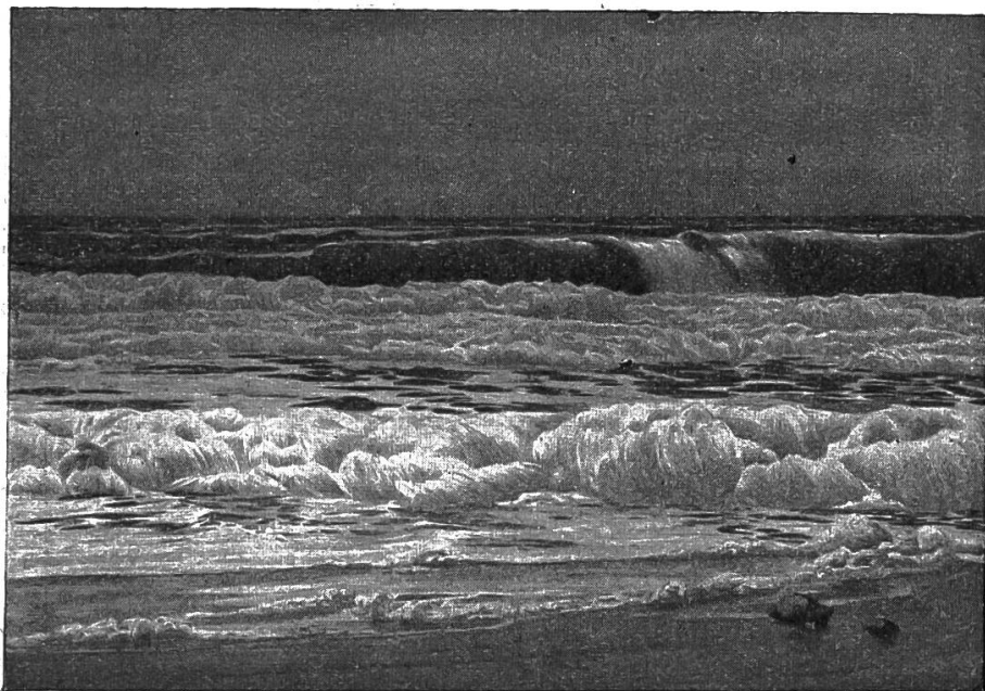
Nr. 1. Meeresbrandung an der Nordsee.

Unter diesem Titel hat der Verlag Franz Schneider, Berlin-Schöneberg, eine Anzahl Wandbilder herausgegeben. Diese Künstlersteinzeichnungen, die sich durch gute Technik und prächtige Farbengebung auszeichnen, sollen eine Auswahl der schönsten und charakteristischsten Landschafts- und Städtebilder Deutschlands bieten. Die erste Serie umfasst folgende Darstellungen Nr. 1. Meeresbrandung an der Nordsee (v. Biese, siehe Abb.); Nr. 2. Winterstille im Schwarzwald (v. Biese); Nr. 3. Sommersonnenschein in der Mark (v. Kallmorgen); Nr. 4. Winteridyll in einem pommerschen Städtchen (v. Hartig). Vor uns liegen die Blätter einer zweiten Serie Nr. 5. Im Wartburghof (v. F. Geyer). Ein Bild von grosser Farbenpracht. Wie ein glühend roter Mantel deckt der herbstgefärbte wilde Wein Mauer und Dach an dem alten Gebäude links und schlingt sich über den Erker zum Dach und an der Mauer des nächsten Gebäudes herum. Leuchtend hebt sich das Rot des Weines und der Dächer ab gegen das Grün der Mauer rechts. In scharfer Klarheit