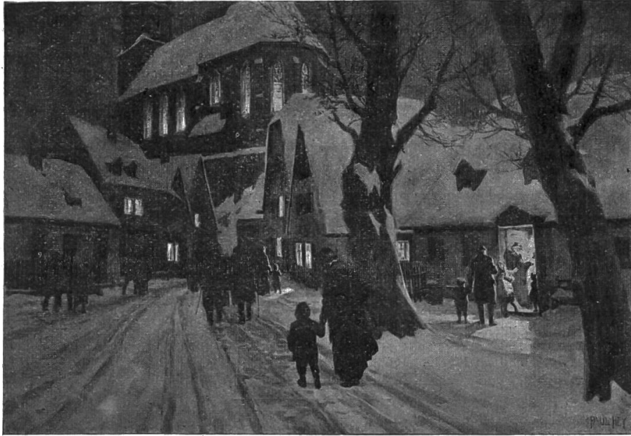
Nr. 24. Christmette.

2. Meinholds Bilder für den Anschauungsunterricht. Die neue Sammlung umfasste bis jetzt folgende zwölf Darstellungen: Frühling: Nr. 1. Mühle, Nr. 2. Auf dem Felde, Nr. 3. Garten, Nr. 4. Wald; Sommer: Nr. 7. Kornernte, Nr. 8. Heuernte; Herbst: Nr. 15. Weinlese Nr. 19. Bauernhof; Winter: Nr. 20. Mühle, Nr. 21. Auf dem Christmarkt, Nr. 22. Wald; Verkehr: Nr. 26. In der Grossstadt.