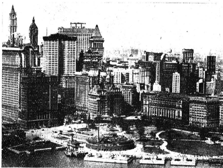
New York, Wolkenkratzer.

Es konnte eine Serie « New York » in unsere Sammlung eingestellt werden, die auf Originalaufnahmen des Herrn E. Ganz in Zürich beruht und ein recht eindrucksvolles Bild der Weltstadt vermittelt. Wir bringen im folgenden das Verzeichnis der Serie (weitere Bilder liefert die Firma Ganz u. Cie., Bahnhofstraße 40, Zürich):