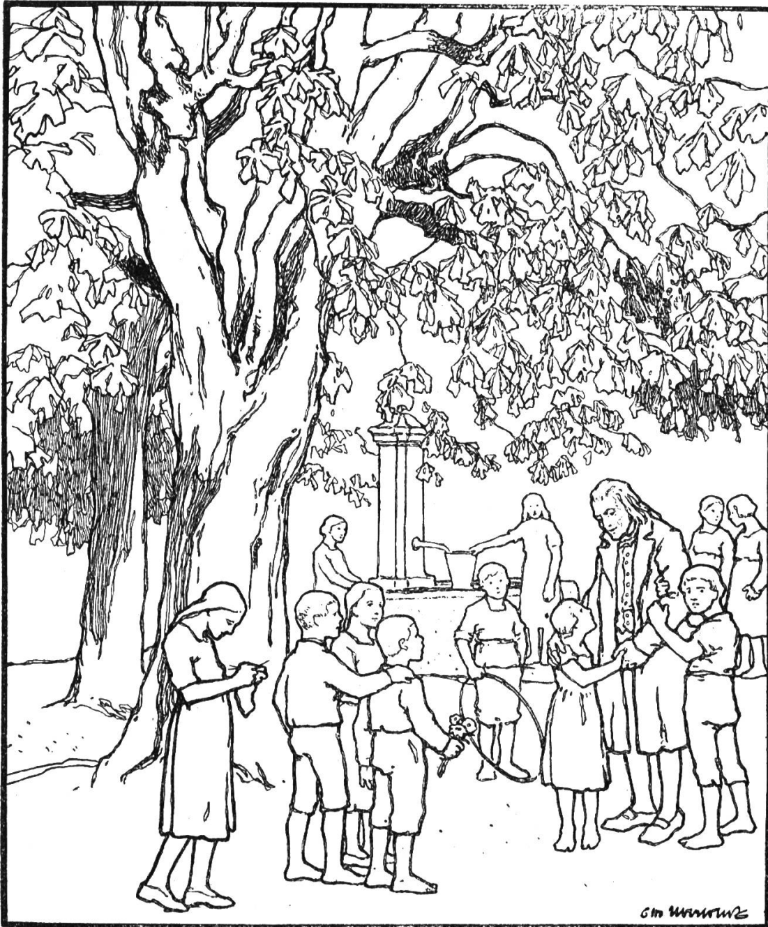
Pestalozzi in Beuggen.

Inhalt: Vor hundert Jahren: Pestalozzi in Beuggen. — W. Pragers Rechen- übungstafel. — Ausstellung für gewerbliche Fortbildungsschulen im Pestalozzianum Zürich. — Neue Bücher - Bibliothek.