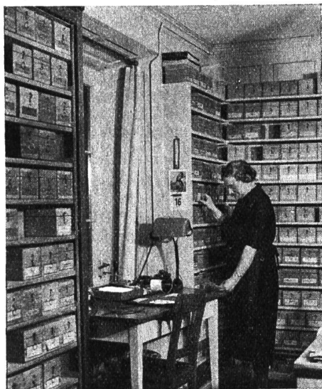
Die Lichtbildersammlung zählt ca. 500 Serien mit insgesamt ca. 10000 Bildern.