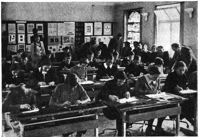
Eine Zeichenstunde im Neubau.

Ueber die Herbsttagung im Tessin (7.—11. Oktober) ist in einer früheren Nummer des «Pestalozzianums» ausführlich berichtet worden. Hier soll nur