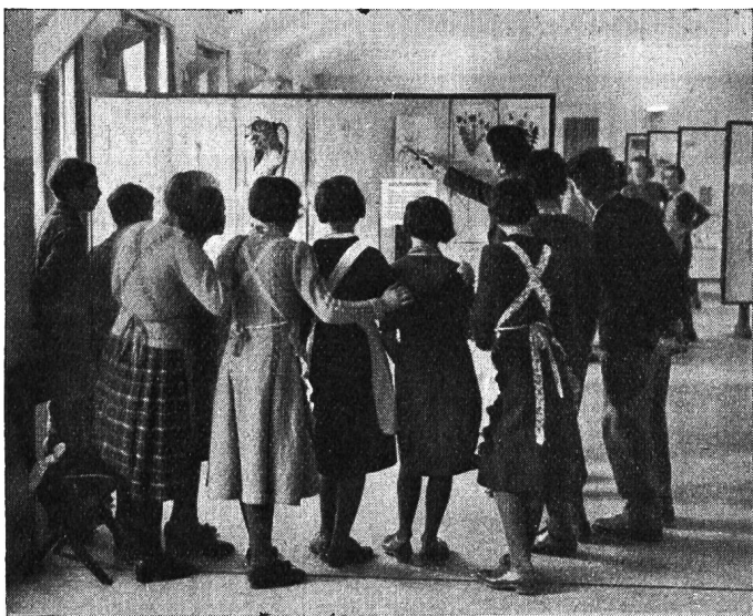
Eine Schulklasse besichtigt die Zeichenausstellung im Neubau.

Die Jugendbühne im Neubau fand auch im Berichtsjahr Zuspruch. Es kamen zur Aufführung: «Schwan, kleb' an!» (Rud. Hägni), «Gustav, der Waisenknabe» (Gottfr. Hotz), «d'Stross» (Oberschule