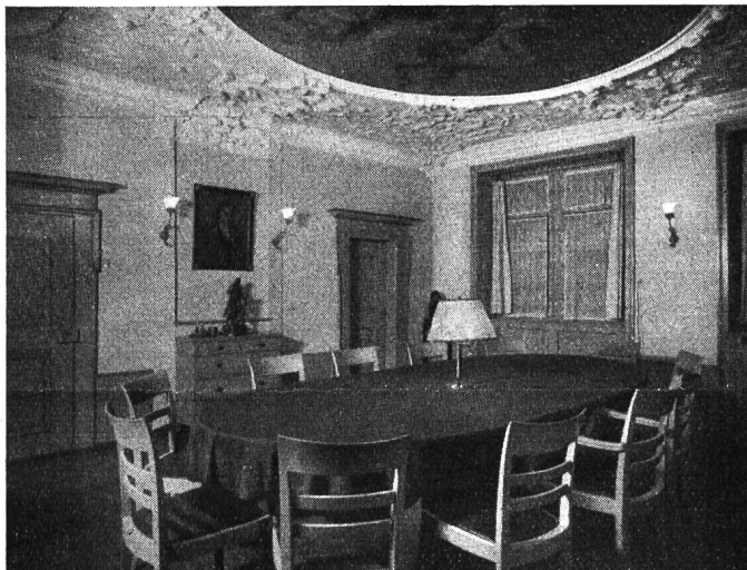
Das Sitzungszimmer im Grebelhaus.

Heizschwierigkeiten zwangen im Spätherbst dazu, auf Ausstellungen im Hauptgebäude zu verzichten. Die kostbarsten Bilder aus den Pestalozzizimmern mussten im Luftschutzraum gesichert werden. Hoffen wir, dass bald ruhigere Zeiten die volle Ausstattung