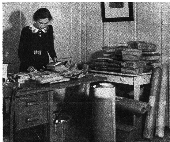
Bücher- und Bildersendungen kommen zurück.

Die Pestalozziforschung ist in unserem Institut vor allem durch die Vorbereitung der Briefsammlung