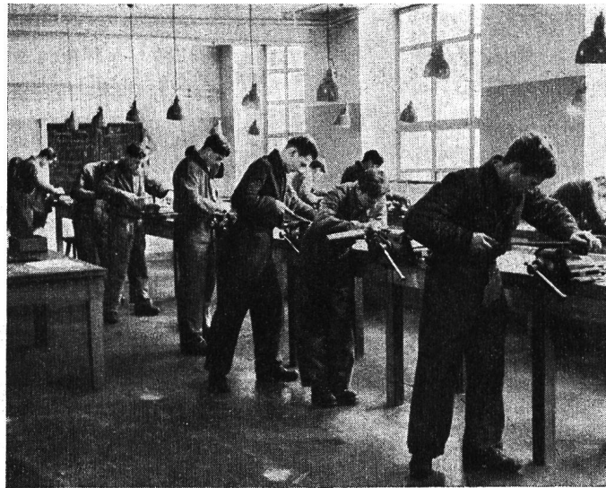
Werkjahr für Jugendliche. Kursteilnehmer an der Arbeit.