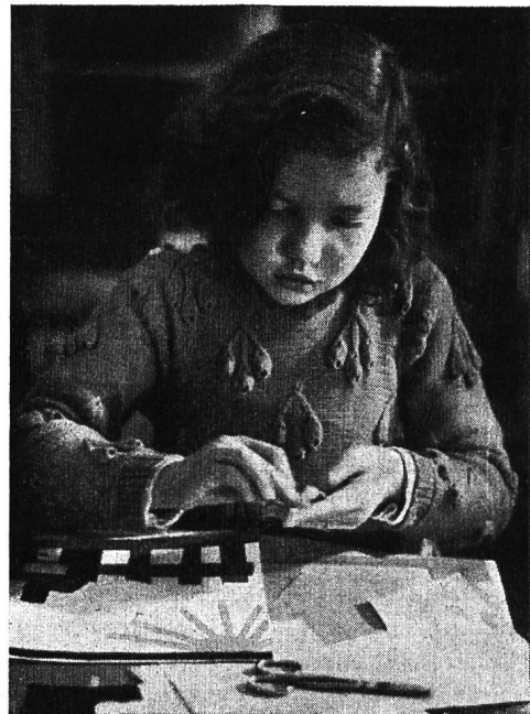
Selbstgemachtes Spielzeug. Kinder kleben ein Bilderbuch.

Nahmen so die äusseren Veranstaltungen einen erfreulichen Verlauf, so darf auch auf eine befriedigende Entwicklung der internen Tätigkeit hingewiesen werden. In Bibliothek und Lesezimmer zählten wir im ganzen 6168 Besucher (4610 aus der Stadt Zürich, 1217 aus dem übrigen Kanton und 341 aus andern Kantonen). Die Bibliothekskommission, die über die Anschaffungen für unsere Bücherei entscheidet, hat in sechs Sitzungen ihre Vorschläge bereinigt. Es sind 1017 Bände in unsere Bibliothek eingereicht worden — Doubletten nicht gerechnet — die, als grösste pädagogische Bibliothek unseres Landes, nunmehr etwa 75 000 Bände zählt.