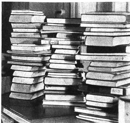
Zum Beginn des Tagewerkes im Pestalozzianum: Ausleihsendungen werden bereit gelegt.

Sicherlich liegt die Pflege solch internationaler Beziehungen im Interesse des Schweizervolkes. Dafür aber sollte der Bund die nötigen Mittel bereitstellen, statt die letzte kleine Subvention zu streichen. Es wäre im höchsten Grade bedauerlich und ein Unglück für unser Land, wenn im Bundeshaus nur noch die Machtansprüche der grossen Wirtschaftsverbände Beachtung finden würden, während stille Bildungsarbeit ohne jegliche Hilfe bleiben müsste.