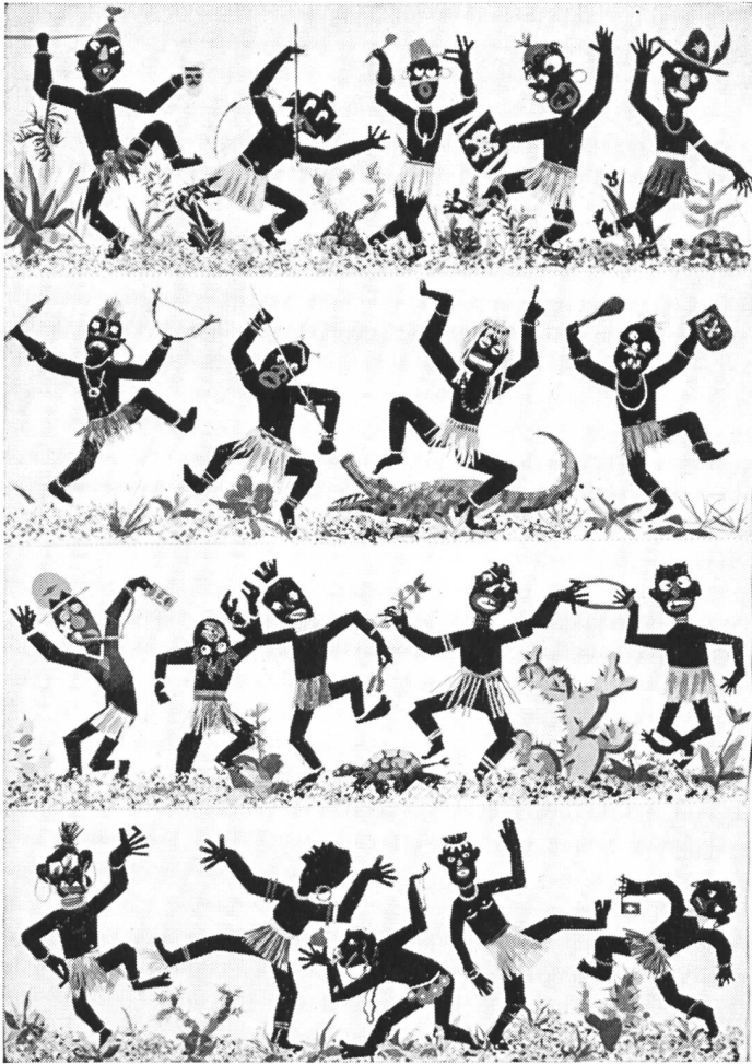
Aus der Ausstellung «Gemeinschaftsarbeiten»

Ein nicht minder glückliches Wirken verdeutlichte die Ausstellung «Gemeinschaftsarbeiten aus dem neuzeitlichen Unterricht». Es ist sicher von höchstem Wert, wenn die Schule mit der Förderung der individuellen Leistungsfähigkeit dem Zögling zum Bewusstsein bringt, wieviel Schönes und Wesentliches in gemeinsamer Anstrengung geschaffen, und nur so geschaffen werden kann. Das gilt auf geistigem wie auf manuellem Gebiet, im intellektuellen wie im künstlerischen Gestalten. Was die Ausstellung bot, legte beredtes Zeugnis für den erzieherischen Wert dieser Bestrebungen ab. Dass ähnliche Haltung im Auslande eingenommen wird, zeigten die Beispiele aus Hamburg, Düsseldorf, Dresden, Lübeck und Stuttgart. Bot die vorangehende grosse Ausstellung eine rein zürcherische Schau, so wirkte hier die internationale Beteiligung anregend