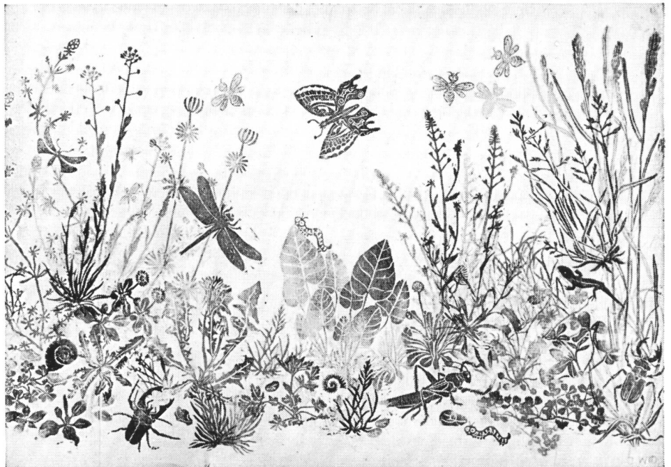
Aus der Ausstellung «Gemeinschaftsarbeiten»