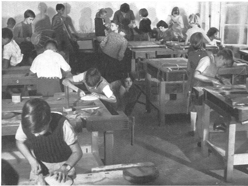
Freizeitwerkstatt im Pestalozzianum

arbeit ausführen konnten. Die Hortnerinnen der Stadt Zürich begingen im Rahmen der Ausstellung das 25jährige Bestehen der städtischen Horte und veranstalteten eine Woche lang Vortragsabende, welche sich eines sehr regen Besuches erfreuen durften.