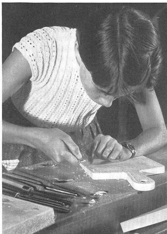
Freizeitwerkstatt im Pestalozzianum

zeigte die verschiedenen Leistungen der Schule und der Öffentlichkeit zur sinnvollen Freizeitgestaltung der Jugend und versuchte den Eltern Anregungen zu vermitteln, wie das Kind in der Familie werktags und sonntags seine freien Stunden zubringen kann. Auf eindruckliche Weise wurde gleichzeitig darauf hingewiesen, dass vor allem gemeinsames Erleben und Erfahren, gemeinsame Freude und Arbeit, die heute leider zu oft auseinanderstrebende Familie wieder enger zusammenschliessen vermag. Namhafte Institutionen wie Pro Juventute, Vereinigung Ferien und Freizeit für Jugendliche, städtische Berufsberatung, Horte der Stadt Zürich, Abteilung Vorunterricht, Turn- und Sportamt der Stadt Zürich, Stiftung Zürcher Ferienkolonien, Wanderkommission der Lehrerturnvereine der Stadt Zürich, Verein für Jugendherbergen, Gesellschaft für