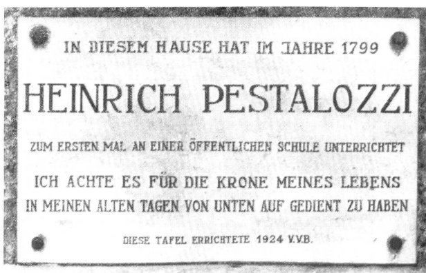
Erinnerungstafel am Haus Nr. 7, Kornhausgasse, ehemalige Hintersässenschule

Es war Pestalozzis eigener Wunsch, nicht sogleich als Theoretiker an einem Seminar zu wirken, vielmehr seine Methoden zunächst als praktischer Lehrer zu erproben. So finden wir ihn nun zunächst an der sogenannten Hintersässen-Schule an der Kornhausgasse (Haus Nr. 7).