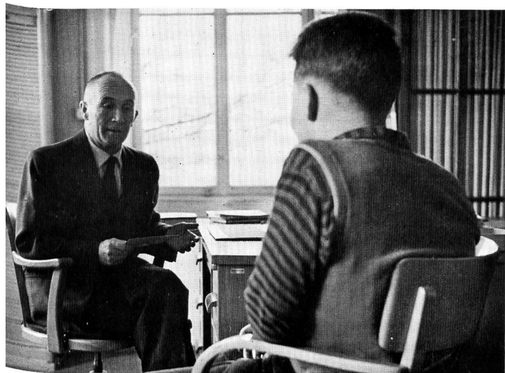
Jugendhilfe durch Gemeinde und Staat