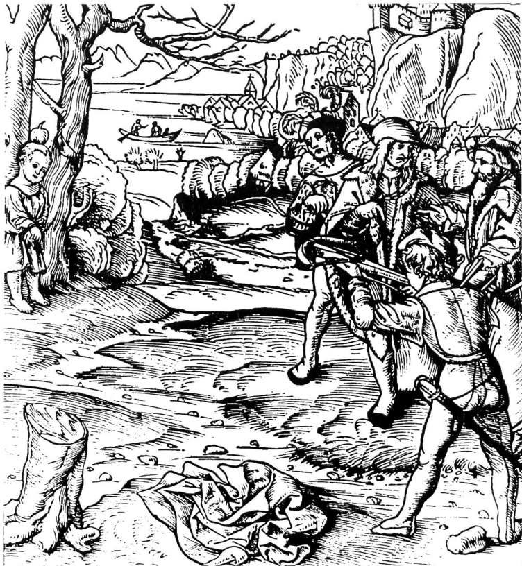
Schillers «Wilhelm Tell» und die Schweiz Holzschnitt aus der Chronik von P. Etterlin, 1507

Im Verlaufe der Monate Februar und März wurden der Lehrerschaft im Neubau des Pestalozzianums die Geschichtslehrmittel aller Schweizer Kantone und solche aus Deutschland und Oesterreich zur Ansicht aufgelegt. Die zahlreichen Bücher boten nicht nur einen sehr instruktiven Einblick in den Geschichtsunterricht des In- und Auslandes, sondern vermochten auch viele Anregungen hinsichtlich der Gestaltung der Lehrmittel und der Veranschaulichung des Stoffes zu bieten. Ferner lagen Werke, die sich im besondern für die Unterrichtsvorbereitung des Lehrers eignen, sowie eine grosse Zahl von Jugendbüchern über geschichtliche Themen vor. In verdankenswerter Weise hatten zudem Firmen die neuesten Geschichtswandkarten, die auf dem Lehrmittelmarkt erhältlich waren, zur Verfügung gestellt. Die Wände des Saales waren mit Schulwandbildern, die Ereignisse einzelner Epochen veranschaulichten, geschmückt. Schliesslich umfasste die Ausstellung noch Dias und Schallplatten. Zahlreiche Kollegen aus ver-