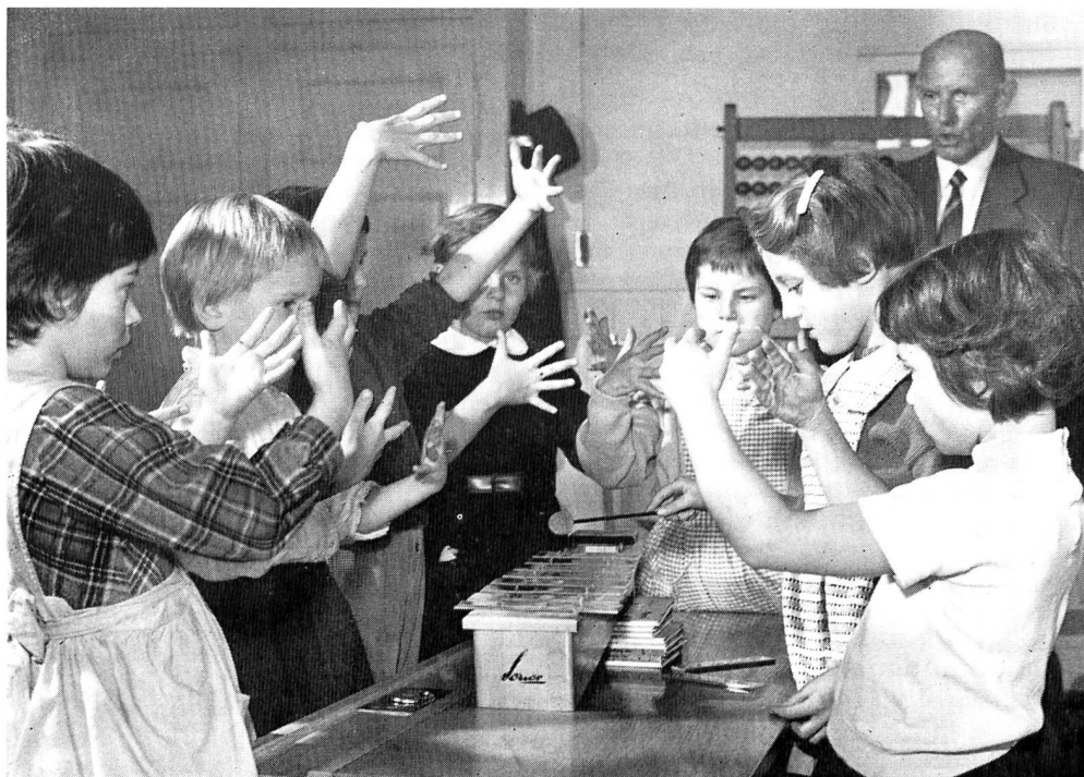
Musische Erziehung auf der Unterstufe

Dank dem grossen Angebot an Kleindias konnte die Sammlung des Pestalozzianums in einem erfreulichen Masse ausgebaut werden. Zu den bereits vorhandenen 220 Kleimbildserien wurden weitere 280 angeschafft, so dass nun für die Schulen und andere Interessenten eine reichhaltige Auswahl zur Benützung bereitsteht. Ein Neudruck des erweiterten Kleimbildkataloges kann nächstens herausgegeben werden. Besonders zu erwähnen sind die Farbphotos von Kunstwerken aus dem Louvre und dem Reichsmuseum in Amsterdam. Sie wurden von