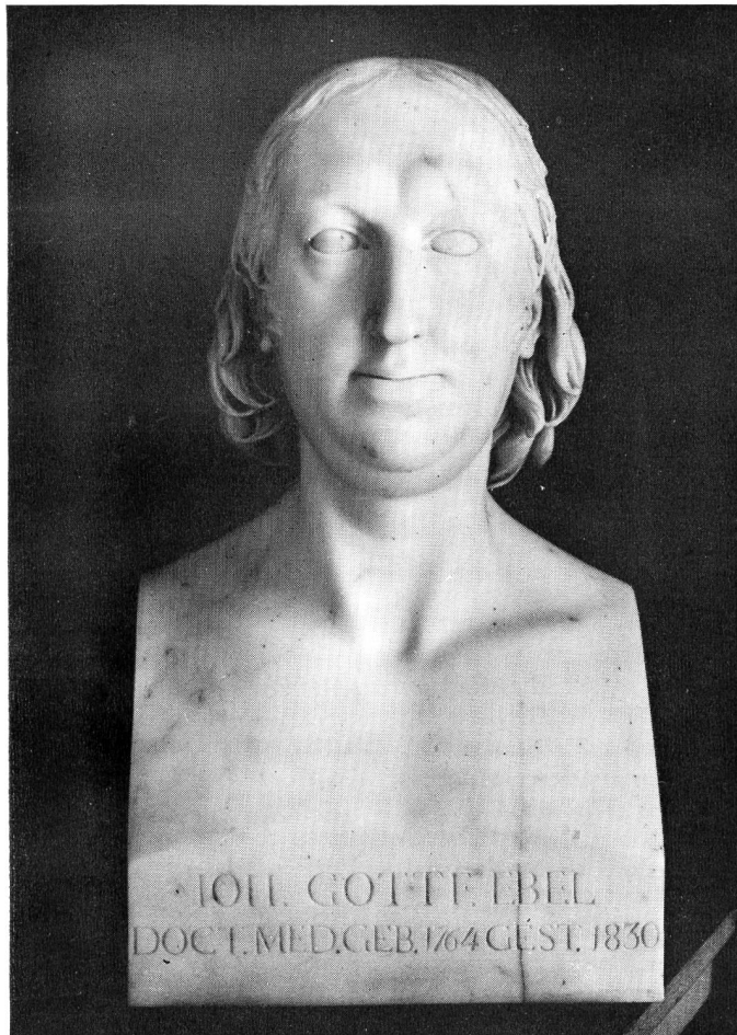
Johann Gottfried Ebel 1764–1830

Es war noch anderes, was den aufgeschlossenen, vielseitigen Dr. Ebel an Pestalozzi zu dieser Zeit interessieren konnte. Schon im Jahre 1787 schrieb Pestalozzi an