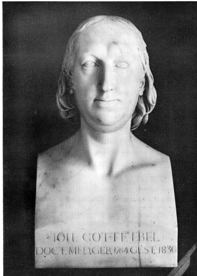
Johann Gottfried Ebel 1764–1830

Es war noch anderes, was den aufgeschlossenen, vielseitigen Dr. Ebel an Pestalozzi zu dieser Zeit interessieren konnte. Schon im Jahre 1787 schrieb Pestalozzi an