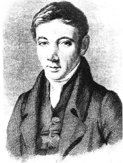
Robert Owen (1823)

Die Problematik dieser geistigen Führung wird von Owen jedoch nicht diskutiert. Er scheint also vorzusetzen, dass er keinen Missbrauch treibt und im gewissen Sinne dem Gemeinwohl verpflichtet ist und bleibt. Ein Blick auf Owens «Klassenabteilung des Alters, nach welcher ein jedes Alter diejenigen