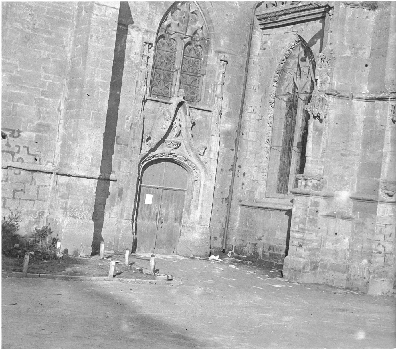
Un photographe allemand devant l'église gothique de Saint-Nicolas de Marville.

Afin de convaincre l'opinion internationale de la présence des œuvres d'art sur le sol français, mais aussi pour se présenter comme «sauveurs» de la culture occidentale et pour témoigner de leur supériorité en matière d'histoire de l'art et de muséographie, les experts artistiques organisent en 1917-1918 deux expositions: l'une à Maubeuge, présentant les pastels de Quentin de la Tour ainsi que d'autres œuvres et objets évacués de Saint-Quentin et sa région, l'autre au musée des Beaux-Arts de Valenciennes, à partir des collections artistiques de plusieurs villes du Nord, rassemblées dans ce qui était le plus important des dépôts d'objets culturels créés par l'occupant 16 . Les catalogues illustrés, édités à ces occasions, appartiennent certes à ces publications destinées à la propagande culturelle envers les pays neutres, mais elles font également preuve d'un grand professionnalisme et d'un réel intérêt pour ce patrimoine artistique. L'étudier et le documenter, notamment par le moyen de la photographie,