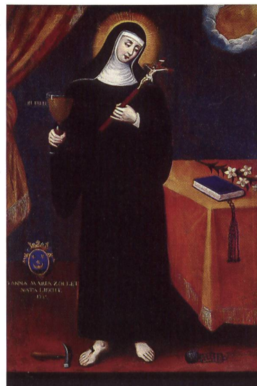
65 sainte Claire - armoiries Liecht