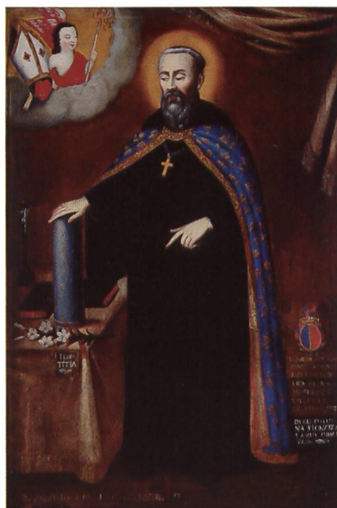
62 saint Alipe - armoiries de Montenach