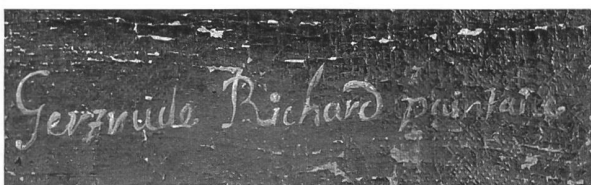
69 Signature de l'Ascension (en bas à droite)