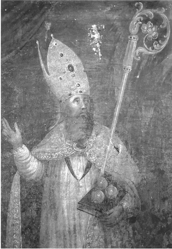
73 Gottfried Bräutigam, saint Nicolas de Myre , vers 1700, huile sur toile, 56 x 42 cm (détail) (Eglise de Wünnewil)