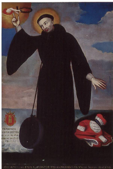
64 saint Antonin - armoiries Gottrau (propriété de la paroisse de Farvagny-le-Grand; déposés dans l'ancien couvent des Augustins de Fribourg, d'où ils proviennent)