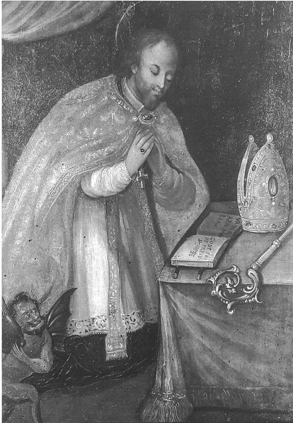
72 Gottfried Bräutigam, saint Théodule, signé sur le livre ouvert , vers 1700, huile et tempera sur bois, 44 x 35 cm (Paroisse de Givisiez)

(1735) 53 ; de même plusieurs séries analogues au cycle des Augustins: les Apôtres de la Collégiale de Romont (1738) 54 , les 14 tableaux représentant la Mission des apôtres de l'église de la Roche, restaurés en 1989/90 par Jan Dik 55 , enfin une galerie de saints franciscains au couvent des Cordeliers de Fribourg 56 .