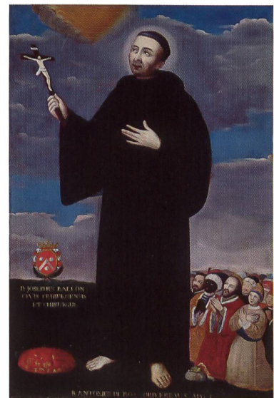
66 bienheureux Antoine - armoiries Ballon