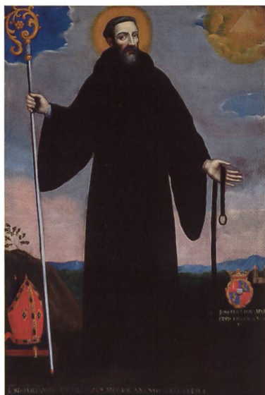
61 saint Simplicien - armoiries Fontaine

L'identification des personnages comme saints ou bienheureux de l'Ordre des Augustins nous a permis de découvrir la provenance des tableaux. Voyons maintenant s'ils correspondent à une composition d'ensemble et à un programme iconographique. Les huit personnages sont représentés en pied, dans un intérieur ou devant un paysage, tournant la tête d'un côté ou de l'autre. Si nous classons ces personnages par ordre chronologique, nous les voyons se mettre par paires, comme des pendants (c'est ainsi que nous les présen-