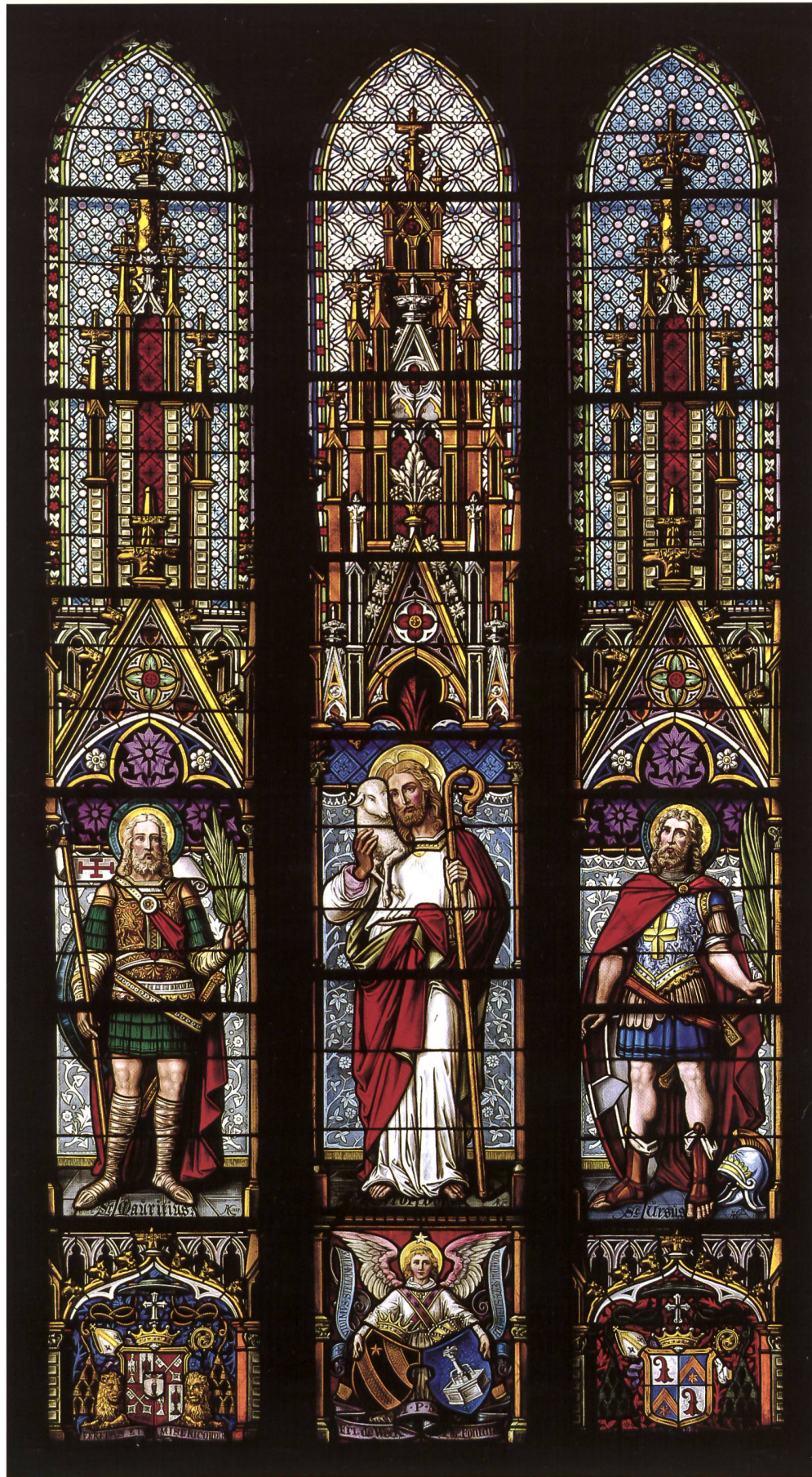
Abb. 5-7 Die drei Chorfenster von Adolph Kreuzer, Zürich-Hottingen 1887, mit dem Guten Hirten und den hl. Mauritius und Ursus.