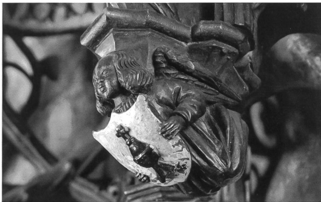
Fig. 105 Ange portant les armes du clergé, au dais des sièges de célébrants, 1515.