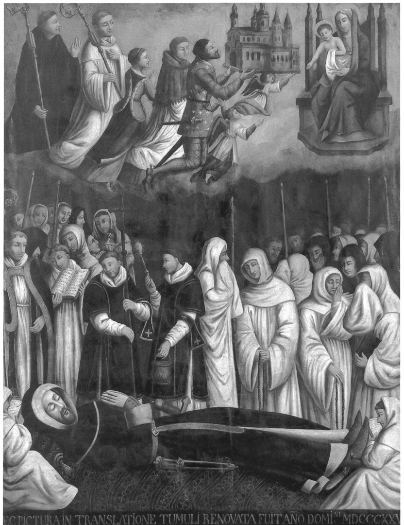
Abb. 4 Beisetzung Wilhelms von Glâne, Emmanuel Sutter, 1825. Öl auf Leinwand, 200 x 156 cm. Vermutlich Kopie einer Darstellung des 17. Jh. Das Bild befand sich ursprünglich im Chor über dem Grab des Klostergründers.

Das Grangiensystem mit arbeitsteiliger Spezialisierung und zentraler Lenkung erwies sich als sehr erfolgreich. Entscheidenden Anteil daran hatten die Konversen (Laienbrüder), die entweder im Kloster oder in den weiter entfernten Höfen wohnten. Ihr Tagesablauf war hauptsächlich auf körperliche Arbeit ausgerichtet, sie waren zu weniger Gebetsleistung verpflichtet und weniger an das Kloster gebunden als die Chormönche. Trotzdem war ihre Arbeit nach zisterziensischer