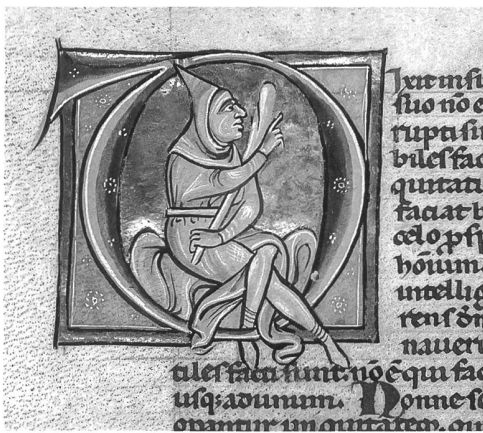
Abb. 7 Miniatur des Buchstabens D mit Darstellung des Toren zum Psalm 53 mit dem Eingangsvers «Dixit insipiens in corde suo: Non est Deus» («Die Toren sprechen in ihrem Herzen: Es ist kein Gott»). Biblia sacra, Frankreich, 2. Hälfte 13. Jh. (Kantons- und Universitätsbibliothek Freiburg, L 71). Die Handschrift ist seit dem 14. Jh. in Altenryf nachgewiesen.

an den Steilhängen des Lavaux über dem Genfersee durch Rodung und Terrassierung schwer zugängliche und schwer zu bearbeitende, aber für den Anbau höchst geeignete Weinberge an. Weniger bekannt ist die extensive Schafhaltung der Zisterzienser auf den Brachfeldern des Mittellandes und in den Weidegebieten des Vor-alpenlandes. Die Schafe waren unentbehrliche Lieferanten von Wolle für Kleider und andere Textilien sowie von Häuten für die Leder- und Pergamentherstellung. Über die Deckung des Eigenbedarfs hinaus wurde die Schafhaltung zu einer blühenden Unternehmung und zum Markenzeichen des wirtschaftlichen Erfolgs. Bald erschienen Schafe als Zahlungsmittel oder als Be-