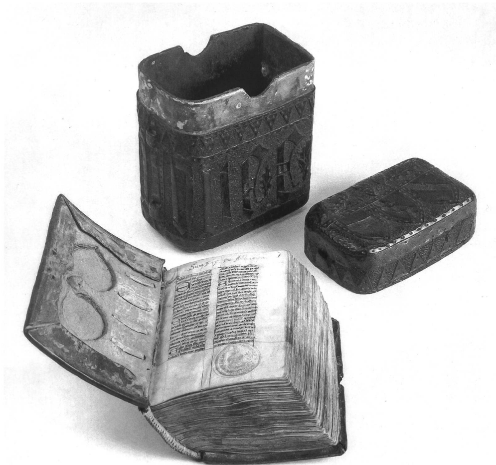
Abb. 8 Gotisches Brevier aus Altenryf mit Vorderdeckel, der zum Einlegen einer Brille vertieft ist, Anfang 15. Jh. Pergament, 13 x 10 cm (Kantons- und Universitätsbibliothek Freiburg, L 74). Das ebenfalls aus Altenryf stammende Futteral, 2. Hälfte 15. Jh., dürfte – eine Neuentdeckung! – dazugehören. Lederschnitt, 15,5 x 13 x 8,5 cm (Museum für Kunst und Geschichte Freiburg, Inv. Nr. 3825). Die Dreiergruppe Brevier, Lederfutteral und Vertiefung im Buchdeckel zur Einlage einer Lesebrille dürften für die Welt des 15. Jh. einzigartig sein.

schaft aufgenommen und erhielt dadurch den städtischen Rechtsschutz. Die Kastvogtei, d.h. die Kontrolle über die Güter und Leute der klösterlichen Grundherrschaft, blieb in den ersten Jahrhunderten bei den Erben der Stifterfamilie von Glâne, den Grafen von Neuenburg-Arconciel und deren Nachkommen. Dem im 14. Jh. erstarkenden und sein Territorium vergrößernden Stadtstaat Freiburg gelang es vorübergehend 1391, endgültig aber erst im Gegenzug zur Unterwerfung unter Savoyen 1452, die Kastvogtei an sich zu ziehen.