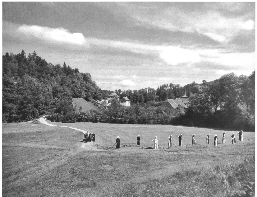
Abb. 9 Der Konvent bei der Feldarbeit (Heuernte) auf der Südseite der Saane (um 1950).

Die Nähe Freiburgs und die zugreifende Aufsicht der städtischen Obrigkeit ersparten Altenryf das Schicksal der übrigen westschweizerischen Zisterzienserabteien, die alle im ausgehenden 15. Jh. in Kommendatarabteien umgewandelt wurden; d.h. der Papst verlieh die Abtwürde an Personen, die, ohne im Kloster zu residieren oder sich