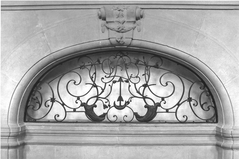
Abb. 106 Bei der grossen Lünette des Treppenhauses kombinierte Bruder Conrad spielerisch Wappen und Initialen des Abtes von Lenzburg mit dem Gitterwerk.