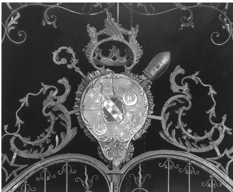
Abb. 108 Die Rückseite der Chorgitterbekrönung mit dem Wappen des Abtes von Lenzburg.

Nach seinem Tod zeigte sich, dass die Schmiedewerkstatt allein von seiner Person gelebt hatte, denn die Produktion nahm nun rasch ab. Von 1788 an wurde kein Eisen mehr zur Verarbeitung angekauft, ab 1790 hatte das Kloster keine Eisenprodukte mehr zu verkaufen.