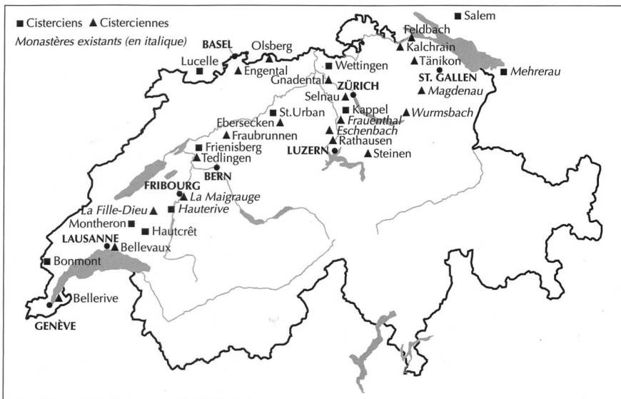
Fig. 130 Les cisterciens en Suisse.

Catherine WAEBER, L'abbaye cistercienne d'Hauterive FR (Guide de monuments suisses n° 469/470), Berne 1990.