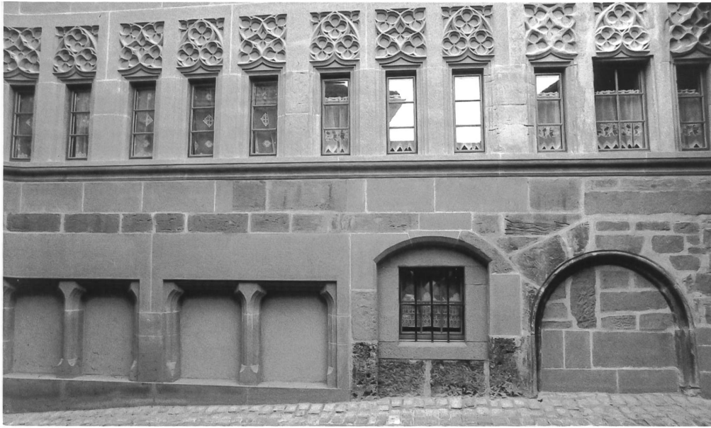
Abb. 9 Westfassade, Detailansicht der Blendmasswerke nach der Restaurierung von 1997/98.

heutigen Normen der Restaurierungstechnik entsprechen, wurden diese aus zwei Gründen an Ort und Stelle belassen. Ihre Entfernung hätte zu weiteren Beschädigungen des historischen Mauerwerkes geführt. Gleichzeitig sind sie ein wichtiges Zeugnis der jüngeren Bau- und Erhaltungsgeschichte. Für die flußseitige Fassade (Abb. 2) war anfänglich ein Neuputz vorgesehen. Detaillierte Untersuchungen ergaben jedoch, dass es sich dabei grösstenteils um einen geschlammten Kalkputz aus dem 17.