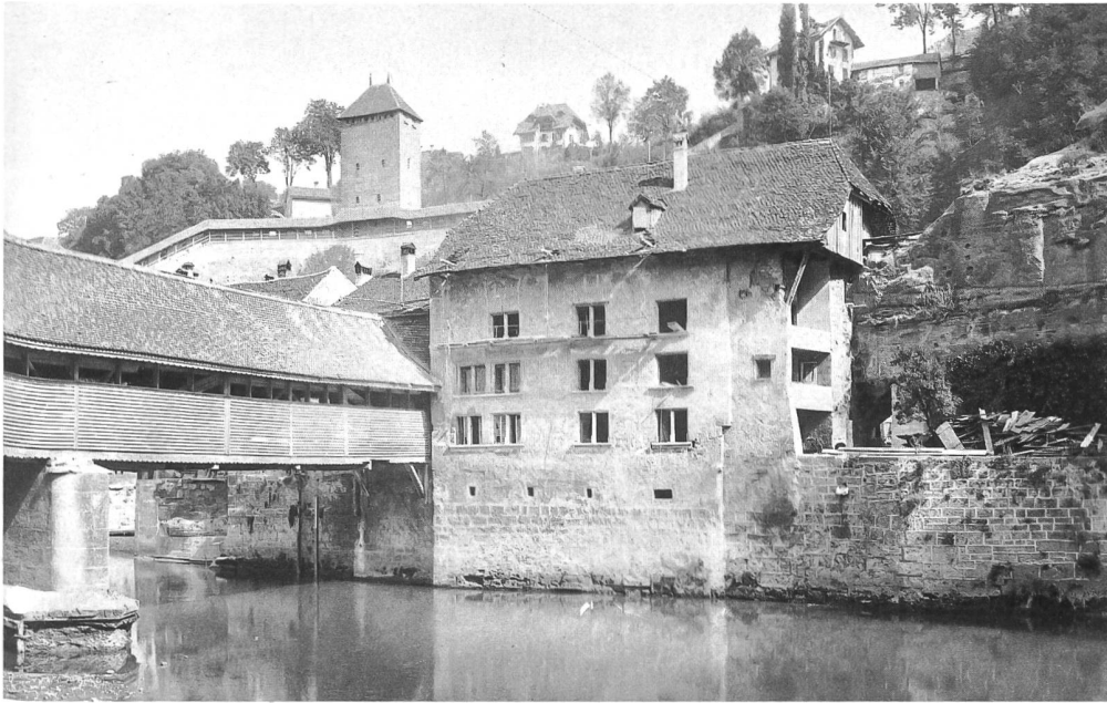
Abb. 2 Historische Ansicht mit Bernbrücke und Haus Mooses (Südfassade) während der Restaurierung von 1923/24.