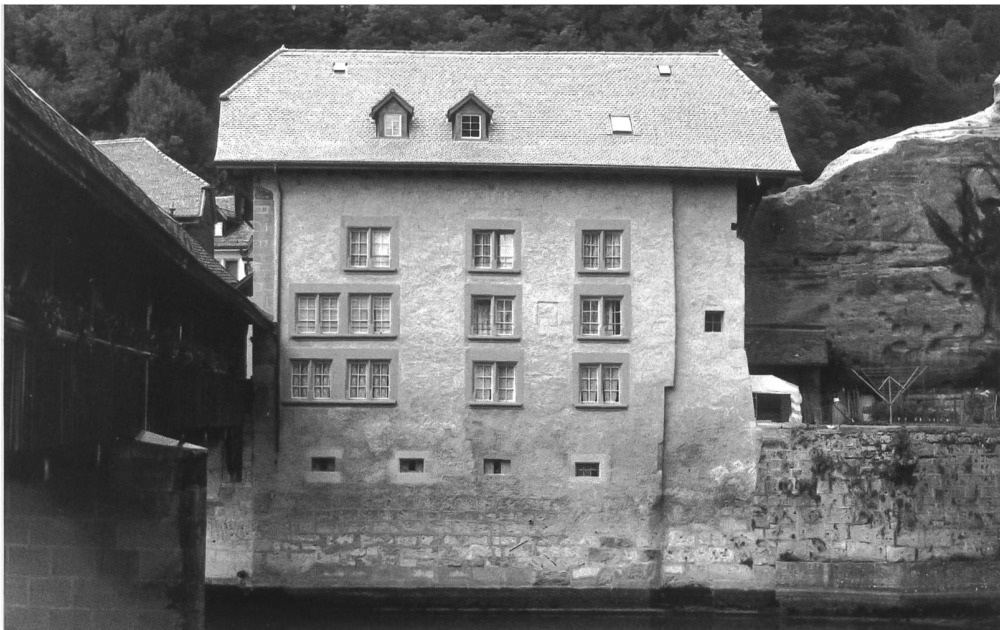
Abb. 6 Südfassade nach der Restaurierung von 1997/98.

werden müsse. Den Eingang habe er von der nordöstlichen Giebelseite in die Mitte der Längsseite verlegt und darüber ein mit Schindeln gedecktes Schutzdach errichtet, das in seiner Ausführung dem historischen Unterstand vor der Schmitte entspreche 14 . Die morschen Holztrepfen im Innern wurden entfernt und durch eine zweiläufige Treppe mit Zementstufen ersetzt. Teilweise wurden auch die Stockwerkshöhen in Anpassung an die neue Raumaufteilung geändert. Mit diesen Massnahmen konnten im Erdgeschoss eine Dreizimmer-, im ersten und