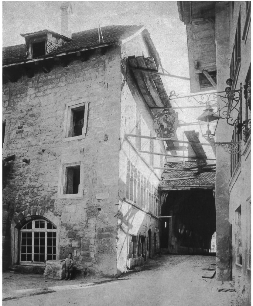
Abb. 1 Westfassade vor der Restaurierung von 1923/24.

Das Baudatum ist unbekannt 4 . Das Mauerwerk der Nord- und der Ostfassade sind nach den 1997 durchgeführten Untersuchungen die älte-