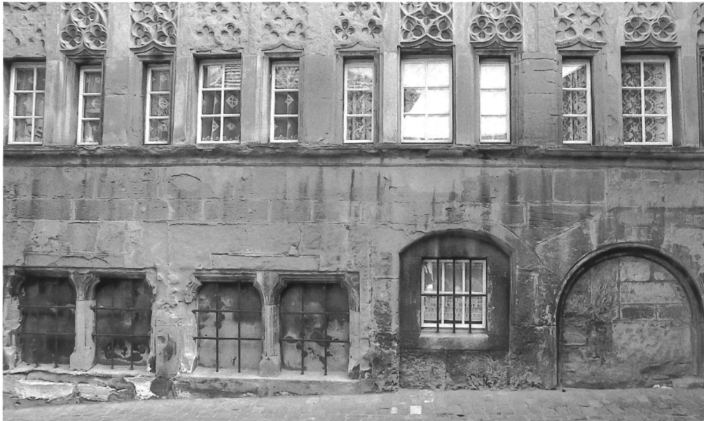
Abb. 8 Westfassade, Detailansicht der Blendmasswerke vor der Restaurierung von 1997/98.

einer Subvention von Fr. 6000.– an den Arbeiten am Aussenbau beteiligte, besuchte der damalige Vorsitzende der Eidgenössischen Kommission, Albert Naef, das Gebäude im Juni 1924 und verfasste anschliessend seinen Bericht 17 . Er lobte dabei die Vorgehensweise der Freiburger, alte und interessante Häuser aufzukaufen, um darin saubere, kostengünstige Wohnungen einzubauen und gleichzeitig die Gebäudehülle zu erhalten. Im weiteren weist er darauf hin, dass ohne den Kompromiss von modernem Innenausbau hinter historischen Fassaden eine Vielzahl von historischen Gebäuden dem Untergang geweiht wären. Er sei überzeugt, dass ebenso in anderen historischen Städten vorzugehen sei, in denen es noch etwas zu retten gebe. An der Restaurierung des Gebäudes selbst kritisierte er lediglich die Schokoladefarbe eines Fensters und den zu weissen Verputz der Kamine. Er schliesst seinen Bericht mit folgenden Worten: «Die Wohnungen sind sauber, hübsch, günstig angeordnet, gut beleuchtet, und ich habe keine weiteren Bemerkungen dazu.» In Naefs Aussagen kommen die Bedrohung des historischen Baubestandes in den 20er Jahren ebenso klar zur Geltung wie sein Pragmatismus in Fragen der Erhaltung.