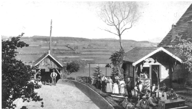
Fig. 4 Le Jeu de douves de l'ancienne Auberge du Cheval-Blanc à Romont, en 1908.

Im Dorf La Joux hat sich eine in der Schweiz einmalige Kegelbahn erhalten. Als Vorgänger des modernen Kegelspiels besteht sie aus zwei hufeisenförmigen, aus Lehm, Zement und Kalk gebauten Mäuerschen. Diese leicht eingetieften «Dauben» dienen als Bahn für die Holzkugeln, deren halbovalförmiger Lauf schwierig zu meistern war. Diese aus dem Mittelalter stammen-