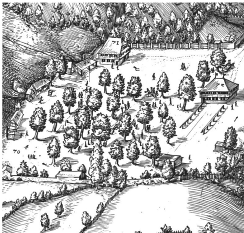
Fig. 3 Les joueurs de boules de la place du Tir, extrait du plan de Martin Martini, 1606.

jouait aux quilles près de l'église. Au XVIII e siècle, la place était généralement louée au sacristain, et les quilles rangées dans le clocher. A la dédicace, des jeux de quilles étaient en outre installés «sous le frêne», sur la place publique en contrebas 10 . Le contrat d'amodiation de la Place des quilles en 1797 précise d'ailleurs que «la douve du côté du chemin ne devra pas être élevée au point de gêner le passage des attelages» 11 , confirmant l'hypothèse selon laquelle la plupart de ces jeux étaient du même type que celui de La Joux. Quand elles n'étaient pas installées près de l'auberge communale, les quilles se trouvaient sur l'esplanade des églises, ce qui fut la source de nombreuses querelles 12 .