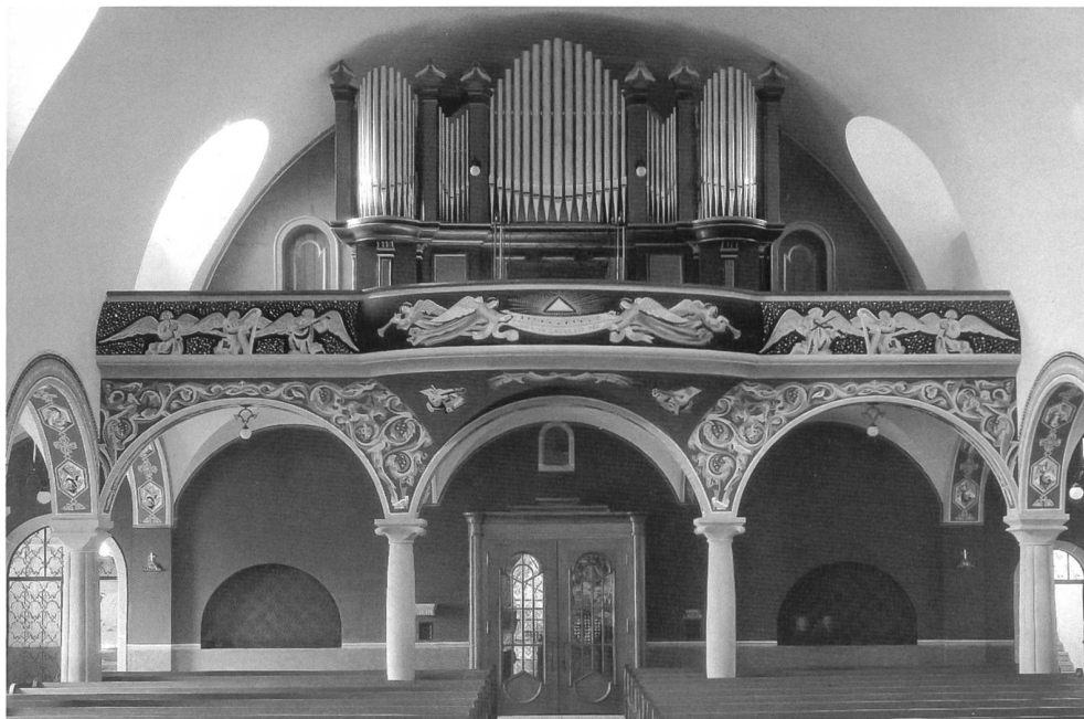
Fig. 84 Semsales, église; orgue de H. Wolf-Giusto (1926). Remarquable unité de la tribune et du buffet d'orgue, conçus par F. Dumas (1922-26). Peintures de Gino Severini. – Semsales, Pfarrkirche; beachtliche Einheit zwischen Innenraum (F. Dumas 1922-26), Emporendekoration (G. Severini) und dem Gehäuse der Orgel von H. Wolf-Giusto (1926).

Les Monuments d'art et d'histoire de la Suisse.