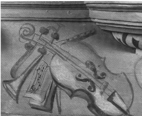
Abb. 7-8 Freiburg, Klosterkirche Magerau; Musikinstrumenten-Bouquets auf dem Basisgesims des Hauptgehäuses: Trompete, Flöte und Viola da Gamba (links) sowie Laute und Zinken (rechts unter der Konsole des Mittelturms). – Fribourg, église de la Maigrange; trophées d'instruments de musique au pied de la tourelle du buffet principal: à gauche, trompette, flûte et viole de gambe; à droite, luth et cornets à bouquin.