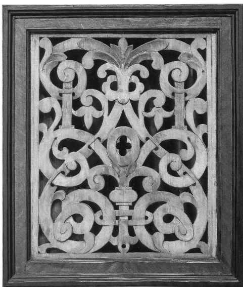
Abb. 6 Freiburg, Bürgerspitalskapelle, Pedalpositiv; Panneau mit durchbrochener Schnitzerei. – Fribourg, chapelle de l'ancien Hôpital des Bourgeois, positif à pédale. Panneau ajouré de tradition maniériste.

telurndecke führte zur Entdeckung einer verborgenen Inschrift, auf der leider mit Sicherheit nur noch der Vor(?) -Name «Christofel» und die Jahrzahl «1648» entziffert werden konnten, weil ein durch das Bekrönen des Mittelturms mittels einer den Hl. Geist darstellenden Taube getriebenes Loch genau an dieser Stelle die integrale Lesung des Nach(?) -Namens des Autors dieser Aufschrift verunmöglicht 19 .