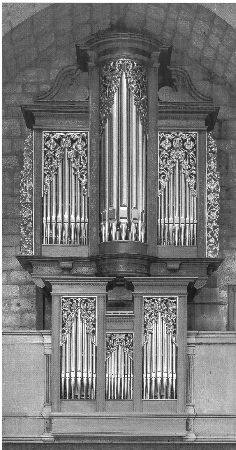
Abb. 9 Freiburg, Klosterkirche Magerau; Hauptgehäuse aus der Bauzeit (1648/49), erstmals mit Rundturm. Nach fast 100-jährigem Exil in Onnens 1986 in die Magerau zurückgeführt, restauriert und ergänzt mit belegtem, aber (zu) gewichtigem Rückpositiv (M. Mathis, Näfels). Nach den originalen Seitenbärten am Hauptgehäuse hat W. Furrer, Brig, die fehlenden Schleierbretter nachempfunden. – Fribourg, église de l'abbaye cistercienne de la Maigrage. Datant de l'époque de la construction de l'orgue (1648/49), le buffet principal montre le plus ancien exemple fribourgeois de tourelle ronde. Après un exil de près de 100 ans à l'église d'Onnens, l'instrument a été replacé à la Maigrage en 1986. Reconstitution du positif de dos (un peu trop grand) et de la plupart des ornements.

Die Realisierung dieser Aufgabe war dem Schaffhauser Orgelbauer Johann Konrad Speisegger (1699-1781) vergönnt 28 : Bereits 1747 dürfte er die wesentlichen Bestandteile – etwa die Windladen – fertiggestellt haben, wengleich Rechnungsbelege für ihn bis ins Jahr 1750 reichen, während sich die Fertigstellung der Fassung des beeindruckenden Gehäuses durch den Bildhauer «schulpauer» (Tschuppauer) noch bis ins Jahr 1752 hinausgezögert haben dürfte (Abb. 24). Ähnlich wie weitere Instrumente dieses Orgelbauers – so, neben der Orgel des «Temple du Bas», auch diejenige der Stiftskirche Neuenburg («Temple du Haut»), welche seit 1874 die Kirche von Vuisternens-Ogoz im Kanton Freiburg ziert – wird Aloys Mooser im Jahre 1815 ebenfalls diese Orgel grundlegend umbauen 29 , wobei nach weiteren