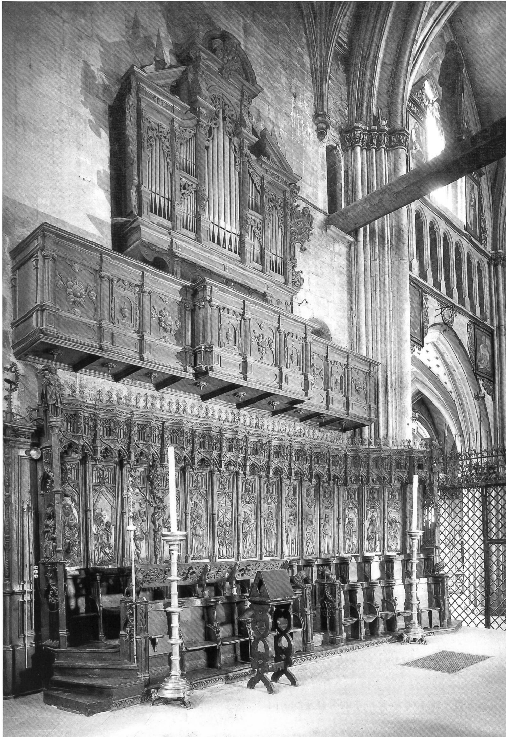
Abb. 12 Freiburg, Kathedrale; die eindruckliche Situation der Epistelseite im Chor mit dem spätgotischen Chorgestühl und der frühbarocken Empore mit der Orgel Sebald Manderscheidts von 1654/57. Laut Vertrag war lediglich ein einmanualiges Werk mit Pedal vorgesehen, das während der Bauzeit um eine Cop(p)el 8' – hinter den Prospekt Pfeifen der Fifferra (in den oberen Mittelfeldern) – und einem auf der Abb. nicht sichtbaren Brustpositiv von 6 Registern erweitert wurde. 1998 Wiederherstellung des ursprünglichen Zustands durch Orgelbau Kuhn, Männedorf. – Fribourg, cathédrale. L'orgue de chœur de Sebald Manderscheidt de 1654/57, avec sa tribune contemporaine baroque, suspendue au-dessus des stalles gothiques tardives. D'après le contrat, on prévoyait un instrument à un seul clavier et pédale, mais finalement on ajouta un Bourdon 8' derrière les tuyaux de la Fifferra (plates-faces supérieures) et un positif pectoral de 6 jeux (invisible sur la photo). Reconstitution de l'état original par la Maison Kuhn en 1998.