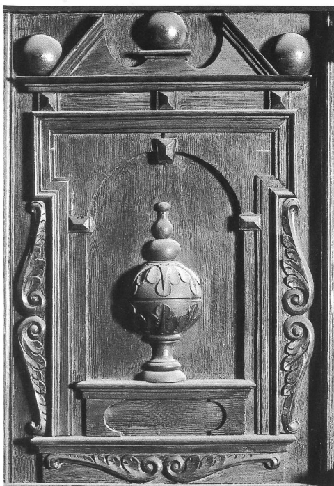
Abb. 14 Freiburg, Kathedrale; Panneau der Empore der Chororgel. – Fribourg, cathédrale; détail de la tribune de l'orgue de chœur.