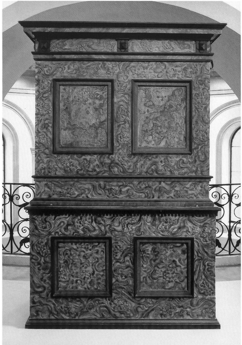
Abb. 3 Freiburg, ehem. Bürgerspitalskapelle; Pedalpositiv von Sebald Manderscheidt um 1667, seinerzeit hinter dem Hauptaltar der Freiburger Spitalkirche zu Liebfrauen aufgestellt. Ansicht des Gehäuses von hinten mit z.T. noch originaler, 1982 durch B. Engler, Untereggen (SG), restaurierter maserholzartiger Fassung. – Fribourg, chapelle de l'ancien Hôpital des Bourgeois; positif à pédale de Sebald Manderscheidt vers 1667, à l'origine placé derrière le maître-autel de l'église Notre-Dame de Fribourg. Vue de l'arrière du buffet, montrant la peinture en faux bois restaurée par B. Engler.

Sensebezirk bekrönt (Abb. 68), einen Bezug zu Alpnach, dem Wohn- und Arbeitsort Schönenbühls – wenn nicht gar zu diesem Orgelbauer selbst – haben könnte. Unter diesen Verzierungen reicht zumindest die schmucke Konsole über dem Mittelstück ins 17. Jahrhundert zurück (wenngleich die gewiss aus späterer Zeit stammenden Musikinstrumenten-«Bouquets» über den Aussentürmen sowie der eigentliche Blumenstrauß über der genannten Konsole a priori mehr das Augenmerk auf sich lenken) 9 ; in der Tat hatte der Heitenrieder Pfarrer Franz Xaver