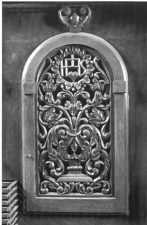
Abb. 15 Freiburg, Kathedrale, Chororgel; je ein Türchen mit durchbrochenem frühbarockem Schnitzwerk ist dem Brustwerk vorgeblendet. – Fribourg, cathédrale, orgue de chœur; l'un des deux guichets ajourés, permettant la diffusion du son du positif pectoral.