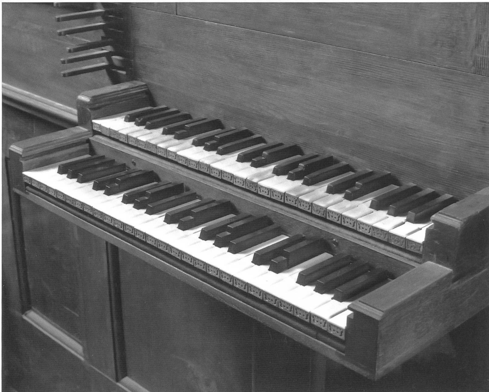
Abb. 16 Freiburg, Kathedrale, Chororgel, Manualklaviaturen; oben Hauptwerk (original), unten Brustpositiv (rekonstruiert 1998), je mit kurzer erster Oktave und geteilten Obertasten für dis/es und gis/as, mit Ausnahme des letzten gis. – Fribourg, cathédrale, orgue de chœur, claviers manuels; en haut, le Grand Orgue (d'origine), en bas, le Positif pectoral (reconstitué en 1998), les deux avec première octave courte et touches brisées pour ré 4 /mi 4 , et sol 4 /la 4 , sauf pour le dernier sol#.