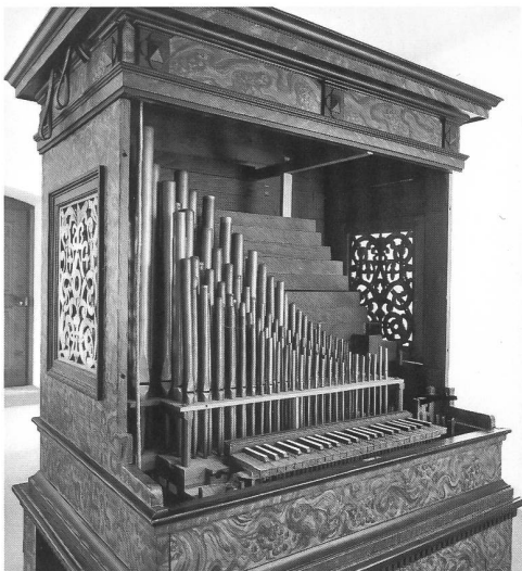
Abb. 5 Das Pedalpositiv nach Entfernung der Vorderfront. – La face antérieure du buffet sans l'élément amovible.

Geheiss der Denkmalpflege die Säule mit dem Wappen der Äbtissin Anne Techtermann aus dem Jahre «1610», die den bis anhin erhöhten Schwesternchor gestützt hatte, im neuen Raumkonzept irgendwo Verwendung finden sollte, weshalb sie zum Trägerelement der neu zu errichtenden Orgelempore bestimmt wurde 18 . Trotz der minutiösen Untersuchung des alten Gehäuses konnte kein Hinweis auf den ursprünglichen Erbauer gefunden werden; eine erst kurz vor der Einweihung durch den Orgelbauer getätigte Öffnung in der originalen Mit-