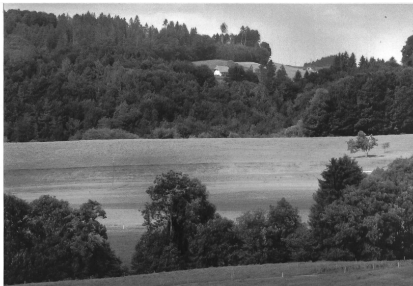
Abb. 2 Blick von Tschleru bei St. Silvester über den Ärgera-Graben auf die gerodete Flur Farnera mit dem Landhaus Sonnenberg; am Horizont das Farneraholz.

Die Matten und Äcker von Lussen bilden eine Gruppe von zehn, im späten 16. Jahrhundert vielleicht erst acht Parzellen 13 , die fast vollständig von der Allmend Rechthalten umschlossen sind. Ob das mit Bäumen und Büschen bestockte Weideland gesamthaft privatisiert und urbar gemacht wurde, bleibt im Dunkeln. Die eine der eben genannten Deutungen des Flurnamens Lussen würde dafür sprechen, die unterschiedliche Grösse der Parzellen und die verschiedenen Zinsbeträge eher dagegen. Die Grundstücke im Zentrum der Gruppe, nämlich der Lussenacker (C) und die Lussenmatten (J, F, G), sind dem Kloster Magerau zinspflichtig. Ihrer Lage nach könnten sie eine erste Rodungsinsel gebildet haben. Jedenfalls liegen die Lussenmatten (J, F, G) günstig in dem am wenigsten geneigten Gelände und der Lussenacker (C) dürfte über