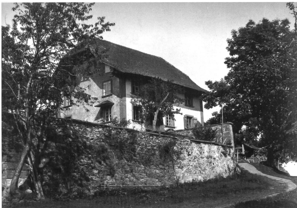
Abb. 1 Das Herrenhaus Sonnenberg mit dem ummauerten Garten, durch den bis vor wenigen Jahren die Grenze zwischen Giffers und Rechthalten lief. Aufnahme von Léon de Weck, 1890.

Ausgehend von den Zuständen im mittleren 18. Jahrhundert, ist es namentlich dank der Urbare des Klosters Magerau möglich, die Besitzverhältnisse bis ins 16. Jahrhundert zurück zu verfolgen. Urbare (franz. grosses) sind Verzeichnisse von Gütern, deren Inhaber dem Eigentümer Anerkennung der Zinspflicht und einen jährlichen Zins schulden. Im Abstand von dreissig bis fünfzig Jahren wurden die Urbare neu erstellt. Für jedes Grundstück sind die Anstösser auf allen vier Seiten und oft auch frühere Besitzer genannt. Diese Verkettung und Vernetzung lässt das Patchwork der Parzellen erschliessen und erlaubt, von bekannten Verhältnissen zu früheren, unbekanntem, vorzustossen. Auch die über zwei Jahrhunderte gleich bleibenden Zinsbeträge helfen, die Parzellen eindeutig zu bestimmen.