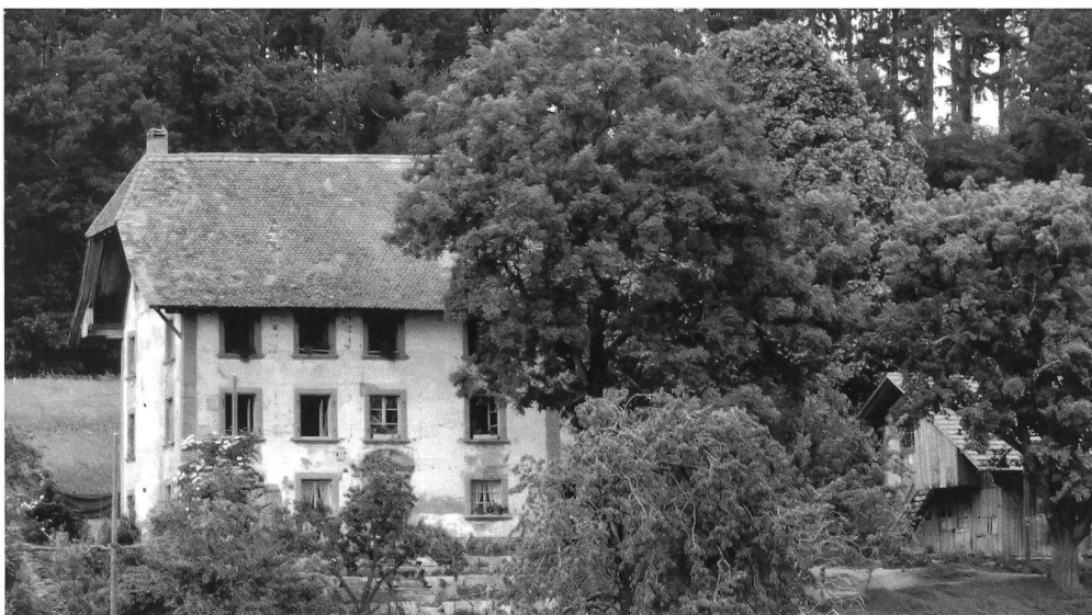
Abb. 6 Das 1693 erbaute «Schloss» Gottrau-Fillistorf erinnert mit seinen Proportionen und der asymmetrischen Fenstereinteilung noch an einen spätgotischen Herrenstock, zeigt sich aber im Übrigen auf der Höhe der Zeit, eher spröde, mit sparsamen Akzenten. Eine herrschaftliche Ausstattung ist nicht vorhanden; vielleicht war der Innenausbau nie ganz vollendet.