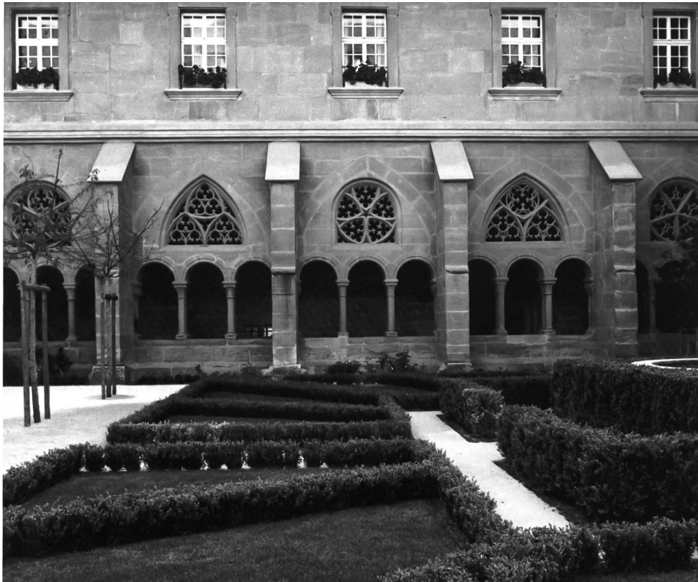
Fig. 6 La galerie occidentale du cloître depuis le nouveau préau. Abb. 6 Blick vom neugestalteten Kreuzganghof in den Westflügel.

croisillon nord de l'église, arborent des décors très sommaires correspondant, au milieu du XII e siècle, tant à une schématisation extrême de motifs antiques qu'aux principes de rigueur cistercienne. Non moins intéressantes sont, dans les murs est et ouest de pourtour du cloître, les traces de plusieurs anciennes ouvertures, condamnées par la disposition gothique, qui permettent une reconstitution des bâtiments communautaires d'origine 3 .