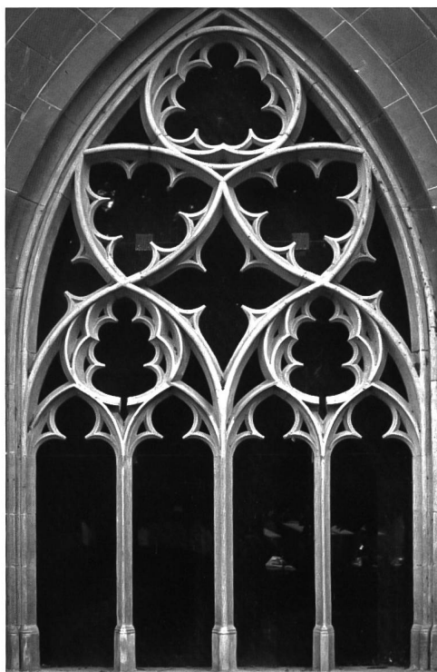
Fig. 7 Grande baie à remplage de la galerie orientale du cloître de la cathédrale de Constance. Abb. 7 Konstanz, Ostflügel des Münsterkreuzgangs, Masswerkbogen der Arkade.

1280 une copie du portail gothique de l'église d'Hauterive élevé trente ans plus tôt. Stylistiquement les remplages des parois claustrales trouvent au début du XIV e siècle de nombreuses correspondances tant dans le contexte cistercien contemporain du cloître de l'abbaye de Maulbronn (1280-1350), des fenêtrages orientaux des églises de Haina (1325) ou de Bebenhausen (après 1320) que dans celui du Haut-Rhin dans lequel nous citerons tout particulièrement les baies des chapelles latérales extérieures nord et sud de la cathédrale de Bâle, élevées