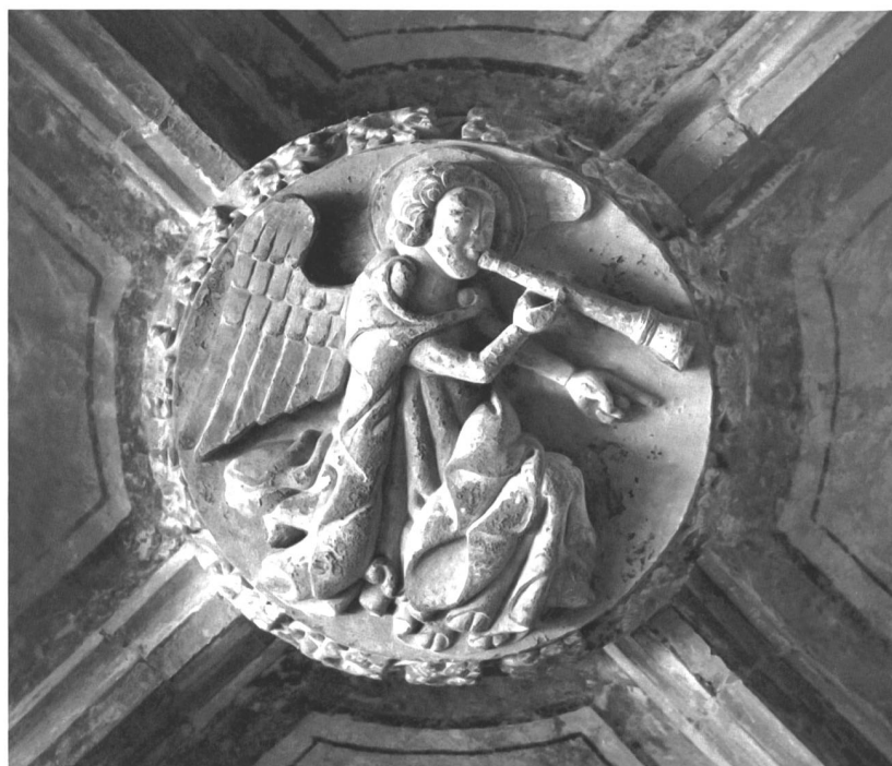
Fig. 10 Clef de voûte d'une des travées angulaires avec son ange sonnante de la trompette. Abb. 10 Posaunenengel vom Schlussstein über einem Eckgewölbe des Kreuzgangs.

La sculpture figurée du cloître d'Hauterive est concentrée sur les vingt-et-une clefs de voûte et sur quelques consoles de ses galeries. Série d'apôtres et de prophètes juxtaposés (galerie est et ouest), les Quatre vivants comme symboles des Évangélistes (galerie nord), quatre anges sonnant de la trompette (travées angulaires), scènes du Paradis terrestre (passage d'entrée) et une Crucifixion (galerie est), autant de figures qui relèvent de la sculpture haut-rhénane de la fin du XIII e siècle. Toutes proportions gardées, il s'agit en particulier de la parenté avec