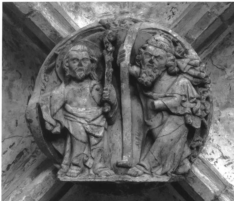
Fig. 11 Une des clefs de voûte de la galerie occidentale décorée d'un prophète et d'un apôtre. Abb. 11 Schlussstein im westlichen Kreuzgangflügel mit Prophet und Apostel.

livrée dès le passage d'entrée au cloître: la première clef de voûte y porte en effet une figuration de la scène du Péché originel, alors que la seconde, qui précède immédiatement l'entrée dans le cloître, présente l'ange placé à la porte du paradis après qu'Adam et Eve en eurent été chassés 20 . Si les prophètes et les apôtres des neuf clefs de voûte illustrent la concordance qui existe entre l'Ancien et le Nouveau Testament, ils s'identifient, par la fonction de la clef de voûte et selon le concept médiéval, aux soutiens de la voûte céleste. Le décor étoilé originel des voûtes du cloître confirme en effet le symbole. Les Quatre vivants et l'Agneau mystique qui décorent les clefs de voûte de la galerie nord sont une claire allusion au ciel apocalyptique, à la nouvelle Jérusalem. Quant aux anges sonnant de la trompette placés sur les clefs angulaires, s'ils rappellent les sept anges apocalyptiques, ils indiquent probablement, de par leur nombre, les quatre directions du paradis, un paradis où le Christ en croix de la galerie orientale a racheté la faute originelle figurée dans le passage d'entrée. Avec leur décor végétal et les oiseaux, symbole de la paix paradisiaque, qui parfois s'y mêlent, l'ensemble des chapiteaux et des consoles du cloître apportent leur contribution au programme général. La forme presque carrée du cloître qui se conforme à la description apocalyptique d'une Jérusalem céleste aussi longue que large parti-