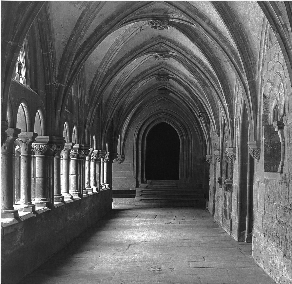
Fig. 5 La galerie orientale du cloître avec au fond l'entrée au chœur de l'église. Abb. 5 Blick in den östlichen Kreuzgangflügel Richtung Choreingang der Kirche.

en plus d'un lieu de passage, celui des processions lors de certaines solennités liturgiques, et le lieu aussi où chaque moine peut déambuler en silence pour méditer, prier ou faire sa lecture spirituelle. Dans la galerie de la «collation», parallèle à l'église, se perpétue, en été, la tradition de rassembler la communauté pour écouter, selon la Règle de saint Benoît, la lecture avant complies.