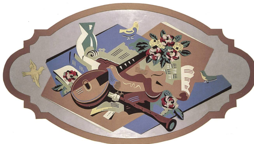
Fig. 118 Gino Severini, Nature morte aux instruments de musique, tribune de l'église de La Roche, 1928.

Le 20 février 1909, l'italien Filippo Tommaso Marinetti publie à la une du Figaro son «Manifeste du Futurisme», texte fondateur d'un mouvement provocateur qui glorifie la machine et la ville, exalte la vitesse, la violence, la technologie et le progrès scientifique dans des représentations du mouvement et du dynamisme de la vie moderne. Des manifestations et des expositions futuristes sont organisées dans des théâtres et des galeries de Paris, Londres, Berlin, Bruxelles, Amsterdam, Munich, Rotterdam, Moscou et Saint-Petersbourg. Le 11 février 1910, cinq artistes – Giacomo Balla, Umberto Boccioni, Carlo Carrà, Luigi Russolo et Gino Severini – publient à Milan le Manifeste