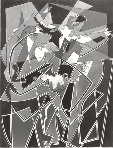
Fig. 121 Gino Severini, Pas de danse n° 1, huile sur toile, 1950 (succ. Severini, Paris).