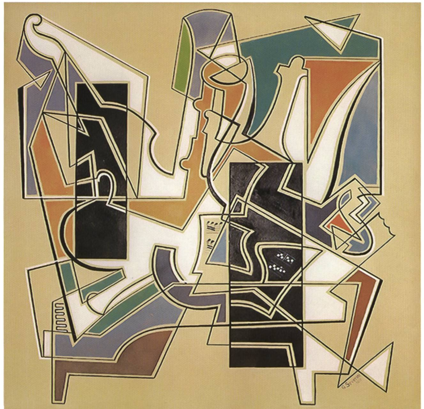
Fig. 124 Gino Severini, Nature morte cubiste aux instruments de musique, fresque du pavillon de musicologie de l'Université Miséricorde, Fribourg, 1949.

En 1945, il renoue avec sa jeunesse, avec le mouvement, le chromatisme vif et frais, le dynamisme, le point divisionniste et l'intégration du volume au plan du tableau. La dernière période de son activité artistique est marquée par le retour des signes formels qu'il avait expérimentés autrefois, une production désignée comme «peinture néo-futuriste» ou «retour à la fantaisie». A cette époque, il travaille beaucoup à des décors et costumes de théâtre. Il expose en Italie, en Suisse, en France, aux Etats-Unis, au Brésil et au Mexique, entre autres. Sa renommée est bien établie. Peintre éclectique, toujours inquiet, hypochondriaque 21 , Severini a résumé mieux que tous les critiques sa quête artistique: «Il y a en moi un débat qui dure depuis mes débuts dans la pein-