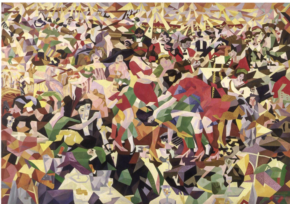
Fig. 119 La Danse du pan-pan au «Monico», huile sur toile, 1959-1960, d'après le tableau de 1909-1911 détruit par les nazis (Musée national d'Art moderne, Paris).