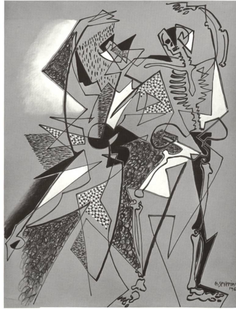
Fig. 122 Gino Severini, La danse macabre, pastel et gouache sur papier, 1962 (coll. part.).