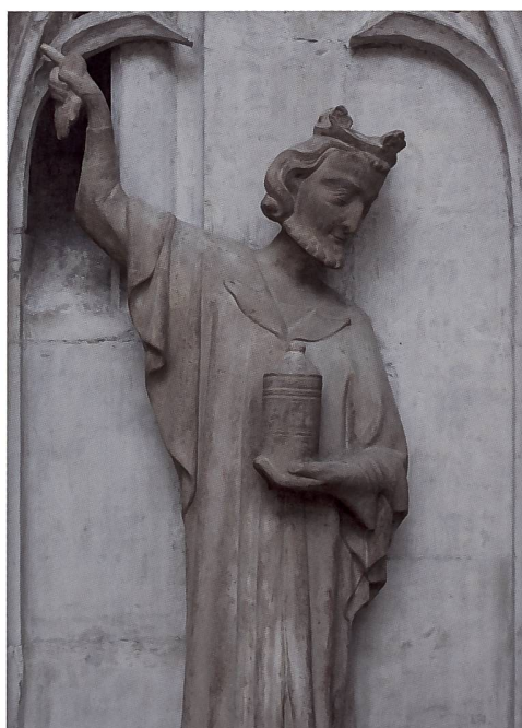
Abb. 109 Der Mittlere der Heiligen Drei Könige, elegant mit dem ausgezogenen Handschuh in der Hand, weist auf den Stern von Bethlehem.

Der Beschluss, die Figuren wieder vor dem Portal aufzustellen, ist aufgrund von mehreren Überlegungen gefasst worden, wobei die naturwissenschaftlichen Grundlagen sich in einem von Christine Bläuer und Bénédicte Rousset verfassten Bericht ausführlich dargestellt finden 4 . Zunächst gilt, dass das Südportal ohne die Originalfiguren weit weniger attraktiv und wertvoll sein würde. Weiter wird die Gefährdung der Statuen vor dem Portal hinterfragt mit den Argumenten, dass gerade die Figuren bisher gut erhalten geblieben sind, dass die Emissionen der Luftschadstoffe stark gesunken sind, der Verkehr nach der Anlage einer Fussgängerzone verschwunden sein wird und die Figuren in Ruhe betrachtet werden können. Das Portal wird gegen Tauben geschützt sein und wie am Westportal seit Jahren mit gutem Erfolg üblich ist,