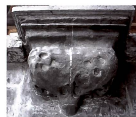
Abb. 103 Neugotische Konsole unter der Zinnenreihe von 1844, Zustand vor der Restaurierung 2016.

2014 wird das in der Zwischenzeit ausgearbeitete Restaurierungskonzept am Portal anhand einer Musterachse erprobt. Mit reversiblen Materialien werden Möglichkeiten der Steinerergänzung, der Reprofilierung und der Fassung getestet und in einer pluridisziplinären Kommission besprochen 3 . Die anstehenden Arbeiten werden klar je einer Gruppe von Bildhauern und einer Gruppe von Restauratoren zugeteilt. Ausgehend vom Erscheinungsbild des Portals um 1890 (Abb. 113), zielt die Restaurierung auf eine möglichst vollständige Wiederherstellung des Bestandes jener Zeit. Angefangen mit dem äusseren Portalbereich bedeutet dies die Neuanfertigung der Fialen und verwitterten Masswerkteile vor den Strebepfeilerstirnen, die Neuanfertigung des Zinnenkranzes, sowie die Reprofilierung des verwitterten Blendmasswerks über dem Spitzbogen. Neben dem gut erhaltenen zentralen Portalbereich mit den wieder auf ihren Konsolen aufgestellten Originalfiguren fällt nun die stark verwitterte Archivolte aus dem Gesamtbild. Hier muss es darum gehen, den noch erhaltenen Fragmenten figürlicher Plastik einen geometrisch gut definierten Rahmen zu geben und sie