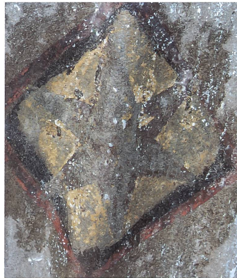
Abb. 111-112 Statue der Muttergottes, durch Sondierungen erfasste Spuren der ersten Buntfassung des Gewands: auf den Stein gemaltes Streumuster. Gegen 1340.

Gewänder und Attribute vergoldet sind. Die Statuen sind ebenfalls reich mit Blattmetall und Farblacken nebst anderen Farben ausgestattet und stehen vor dunklem Hintergrund. Die Befunde für die Wandflächen sind spärlich, weil Teile der Portalwand fast vollständig zurückgearbeitet sind. Dies gilt wohl teilweise auch für die flachen Profilkehlen der Archivolten, wo alte Farbspuren nur noch in Vertiefungen zu finden sind. Trotzdem finden sich genügen Spuren, die eine schwarze Ausfassung der Figurenhintergründe vermuten lassen, was durchaus sinnvoll ist, denn die drei Figuren vor dem Fenster haben bereits natürlicherweise einen dunklen Hintergrund.