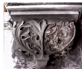
Abb. 104 Neugotische Konsole während der Restaurierung 2016. Rechts die erste Schicht der Aufmodellierung, links abgeschlossene Aufmodellierung.