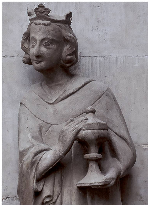
Abb. 110 Der Jüngste der Heiligen Drei Könige.

Mehrere umfangreiche Untersuchungen zur Polychromie seit 1992 geben interessante Einblicke in die Fassungsgeschichte des Portals und der mittelalterlichen Figuren. Die Befunde liegen als Sondierungsprotokolle vor. Rund 200 Querschliffe mit Schichtprotokoll, davon ca. 30 auf Pigmente und Bindemittel analysiert, sind vorläufig zu einzelnen Zwischenberichten zusammengefasst. Anlässlich der aktuellen Restaurierung sind sie um weitere Details zu Fassungsspuren auf den Figuren und den Figurenkonsolen erweitert worden. Dabei ergab sich, dass die beiden äusseren Konsolen der Seitenwände, formal mit zwei Konsolen der Portalwand übereinstimmend, keine Spur polychromer Fassung zeigen,