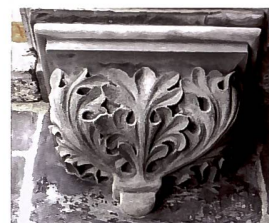
Abb. 105 Neugotische Konsole, restauriert nach Befund und alten Aufnahmen.