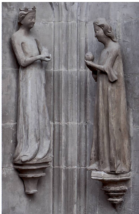
Abb. 108 Die Königin von Saba und eine der von Nikolaus beschenkten Jungfrauen.

fragmente stehen unkenntlich vor verschwommenem Hintergrund. Diese Lücken sind durch Abwitterung der filigranen Teile von Baldachinen und der Abspaltung von ganzen Figurenteilen entstanden. Der Verwitterungsvorgang ist folgender: die Werksteine der Archivolte sind «im Lager» versetzt, d.h. die natürliche Schichtung des Sandsteins liegt parallel zu den Fugen. Diese Schichten sind nicht vollkommen homogen, sondern es gibt mehr oder weniger dichte und wasserundurchlässige Schichten, so dass ein Sandstein nach langer, extremer Bewitterung in Lagen zerfällt. Bei den Werkstücken der Archivolten findet man zahlreiche freistehende Teile wie Hände, Attribute, Köpfe und Bärte bei den Figuren, Masswerkteile und Blätter bei den Baldachinen. Mit der lang andauernden starken Belastung durch Feuchtigkeit, und wenn die Figur zusätzlich noch in geneigtem Winkel verbaut ist, kann ein freistehender Teil plötzlich abrutschen. Es gilt, diese Lücken durch gezielte Ergänzungen zu verkleinern oder zu schliessen, indem zuerst die nicht-figürlichen Fehlstellen ergänzt werden. Bei der äusseren Hohlkehle sind dies die Blätter der Blattbaldachine, die anhand von historischen Aufnahmen rekonstruiert werden können, in der inneren Archivolte die gotischen Masswerkbaldachine. Die Ergänzungen werden so gehalten, dass die noch vorhandene Originalsubstanz nicht konkurrenziert wird und als