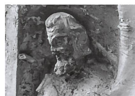
Abb. 106 Kopf eines Propheten an der Archivolte, Zustand 1977. Trotz fortgeschrittener Verwitterung ist die Verwandtschaft mit dem mittleren König unverkennbar (Abb. 109).