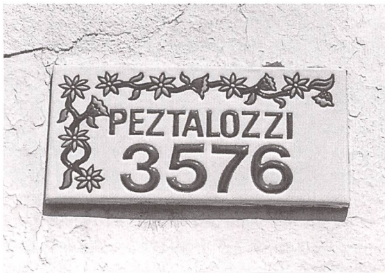
Straassenschild aus Argentinien

Mit der Frage nach dem Stoff, aus welchem die Mythen geschaffen sind, werfen wir einen Blick in die Gegenwart: Wer ist heute auf dem besten Weg ins Pantheon der Heroen der Zukunft?