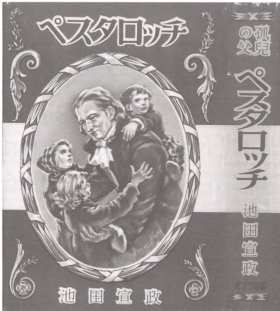
Pestalozzi-Verehrung auf japanisch

sierten Erinnerns – und dazu sind immer auch solche Gedenkanklässe zu zählen – in sich ein Beitrag zur Mythenbildung ist. Dies kann auch ein kritischer, gegenwartsbezogener Ansatz nicht verhindern. Denn die Verbindung von Aufklärung und Besinnung – auf den ersten Blick ein Paradox – trägt wesentlich zur profanen Heiligsprechung historischer Persönlichkeiten bei. Besonders eindrücklich lässt sich dieser Mechanismus aufzeigen anhand der Pestalozzibilder, wie sie jeder Gedenkanklass seit 1846 geschaffen und verbreitet hat.