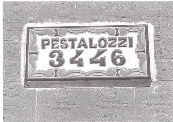
Strassenschild aus Argentinien

politischer und sozialer Umwälzungen. Bis zur Helvetik und ihrem Scheitern versuchte Pestalozzi sein Anliegen in erster Linie auf politischem Wege durchzusetzen. Enttäuscht durch die Ereignisse der Zeit, legte er alle seine Hoffnungen auf die Entwicklung und Verbesserung des Individuums: Eine zentrale Aufgabe kommt dabei der Mutter zu.