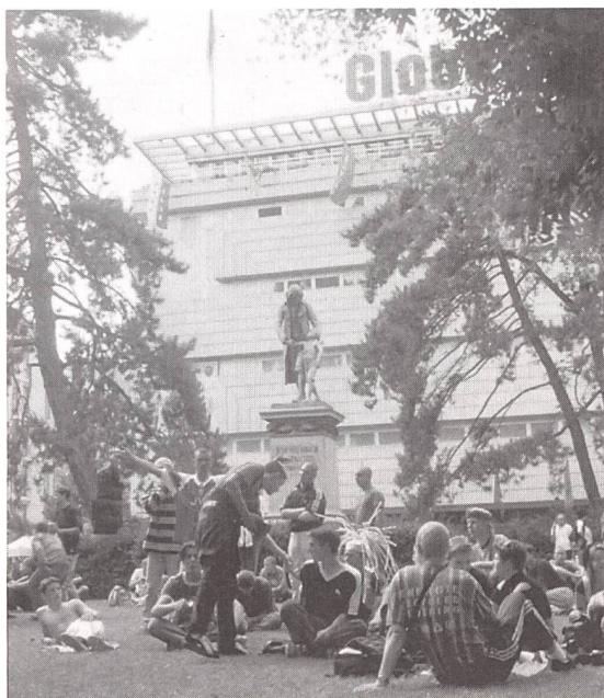
Vor dem Pestalozzi-Denkmal in Zürich 1995

Mutter, Armut und Methode – in ihrem zeitgeschichtlichen Kontext dargestellt, verweisen die drei Begriffe auf Pestalozzis Traum, die ökonomische und ethische Selbständigkeit des Volkes durch Erziehung und eine der Menschennatur entsprechende Politik. Gezeigt werden aber auch die Grenzen dieses Traumes in der Praxis und in einer Zeit tiefgreifender ökonomischer,