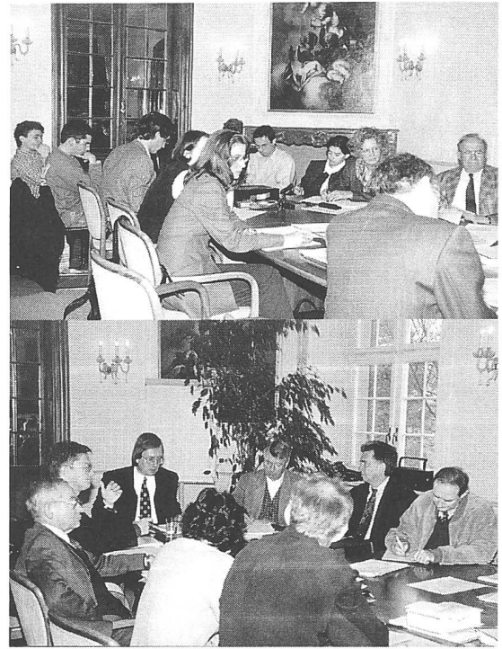
Impressionen aus dem Pestalozzi-Kolloquium ...

zügen durch Einführung der Kategorie einer individuellen Sittlichkeit und auf der Ebene einer philosophisch-anthropologischen Betrachtungsweise bezeichnen.