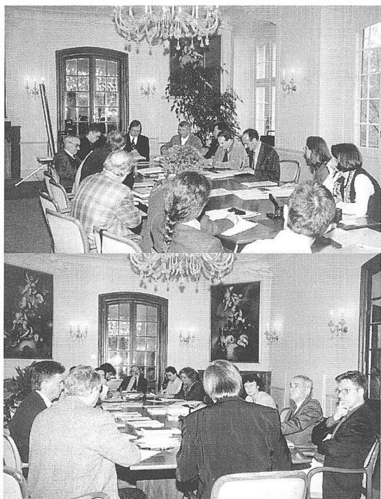
... am Pestalozzianum in Zürich