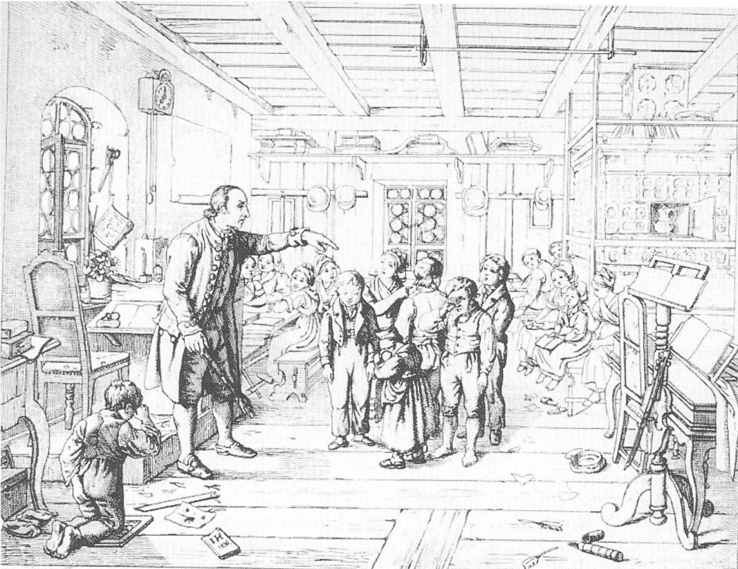
„Vollständige harmonische Entwicklung aller Anlagen eines Menschen?“ Aus: Schiffler/Winkler 1991

Das ist so etwas wie die Doktrin der „Menschenerziehung“. Grundlegend ist die Aktivität des „empfindsamen Wesens“, das nicht passiv lernen kann. Seine Unterscheidungsfähigkeit muss je proportional zu seinen Kräften verstanden werden. Erst wenn ein Überschuss an Kräften vorhanden ist, der für den unmittelbaren Lebensunterhalt nicht gebraucht wird, entwickelt das aktive Wesen spekulative Fähigkeiten, die den Kräfteüberschuss (und nur ihn) in eine Richtung lenken kann, die die unmittelbare Situation übersteigt. Wer also die Intelligenz entwickeln will, muss die Kräfte kultivieren, die sie lenken sollen. Die Intelligenz lenkt sich nicht selbst, sie ist eine Funktion der Natur und entwickelt sich mit ihr. Geist entsteht nicht aus sich selbst, sondern bedarf der Unterstützung und Absicherung der Natur.