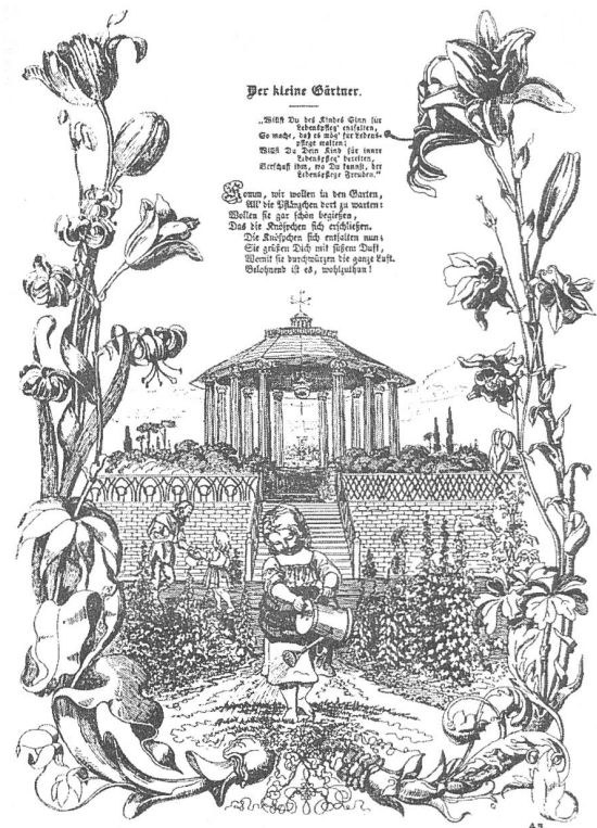
Das natürliche Kind. Aus: Fröbel/Pfaehler 1982

Natur ist Schöpfung , letztlich ideelle Schöpfung, anders wäre sie nicht "divin". Wer damit im Widerspruch steht, kann nur das finale Unglück erleben, eben das macht die Arroganz des Bösen aus. Die richtige Erziehung 3 legt die Grundlage für Tugend und Glück, sofern sie im Einklang mit der Natur steht. Die natürliche Erziehung ist die des Hauses , und im Haus mehrheitlich der Mutter und nicht des Vaters 4 . Im juste milieu der Familie (S. 378) lernen Kinder unaufhörlich (S. 374), vorausgesetzt ihre "curiosité naturelle" (S. 375) und "une petite vanité naissante" (ebd.). Kinder lernen spielend (S. 375f.), unterstützt von der "tendresse" der Mütter, soweit diese nicht hypokritisch wird 5 . Kinder beobachten die Fehler der Erwachsenen (S. 380), sie unterwerfen sich dem Gesetz, aber registrieren sehr ge-