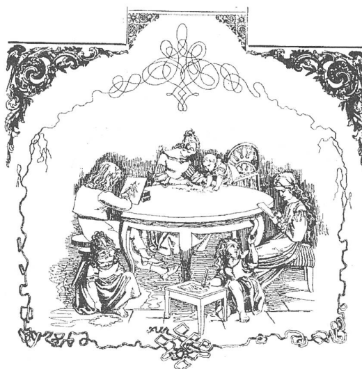
Harmonische Selbsttätigkeit in der Wohnstube Aus: Fröbel/Pfaehler 1982

Deutlich ist aber von Schulbildung die Rede, die "études publiques" (La Chalotais 1996, S. 36) sollten erneuerten Schulen anvertraut werden, ohne länger ei-