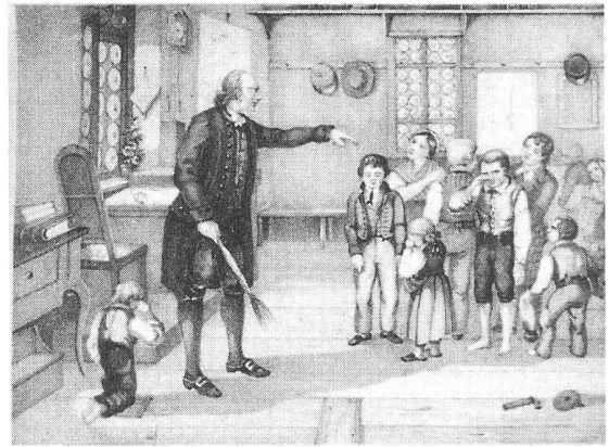
Die Dorfschule (Erziehender Unterricht?)

Der These Oelkers, dass „Schulbildung ... einfach der vielfache Effekt von Schule, Wissensvermittlung, Sozialisation, versteckten (und auch öffentlichen, RV) Lehrplänen, Abschlüssen und Berechtigungen“ ist (NPBI 2/99, S.15), kann vorbehaltlos zugestimmt werden. Die Schulpädagogik verfügt nicht über ein oberstes und umfassendes Ziel. Gera-