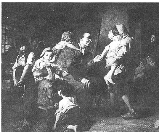
Pestalozzi bei den Waisen in Stans (Erziehender Unterricht?)

Die Schule hat in ihrer Robustheit die aus der Position der Menschenerziehung heraus formulierte Kritik tatsächlich meist gut überstanden. Schwäche zeigt sie aber seit jeher in der Bewältigung der Überfülle des "Stoffes", den sie vermitteln will. Die Kritik dieser Seite der Wissensschule ertönte und ertönt weiterhin nicht nur aus pädagogischem Munde. Eltern und "Abnehmerinstitutionen" erwarten von der Schule Wesentliches, Nützlich und – Gutes. Die Lösung dieses alten curricularen Problems ergibt sich nicht aus den immer wieder zum Scheitern verurteilten Versuchen, den kulturellen Grundbestand zu definieren (core curricula, eiserne Rationen, Grundwissen etc.), sondern nur mit Hilfe pädagogischer Kriterien. Es sind letztlich die gleichen Bewegungen des Auswählens von Lebenswelten, des Versuchs, Weltausschnitte und symbolische Repräsentationen verständlich zu machen und des Antwortens auf Wertfragen, die von Eltern für ihre Kinder wie von Schulen für ihre Schülerinnen und Schüler vollzogen werden. Diese Bewegungen